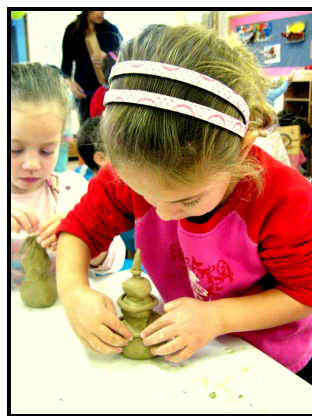
נוגה בת 1.5

התנסות הסטודנטיות בחמר שהוא אחד המדיומים הבסיסיים של האמנות בילדות המוקדמת