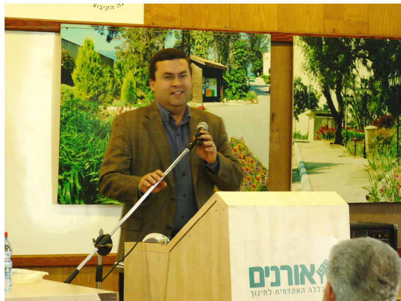
פרופ' עודד ליפשיץ מרצה ביום העיון "ללמד תנ"ך עכשיו 3"