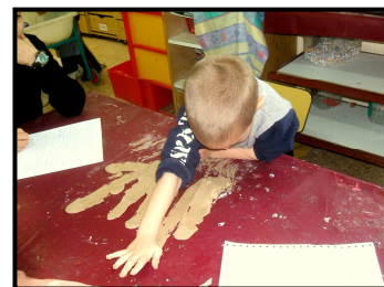
הדר בן 4.0

פעילות ילדי הגן בחמר כפי שתיעדו הסטודנטיות, בצילום ובכתב. מחומרים אלה נבנו התערוכות