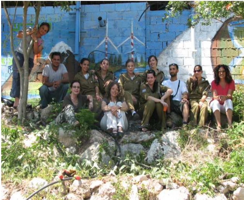
ציור הקיר בנושא הסביבה על גבי המחסן בגן הבוטני במסגרת הפעילות בקורס: "דידקטיקה של האומנות בקהילה" בהשתתפות סטודנטים מהמכון לאמנות באורנים וקבוצת מורות חילות הלומדות במכללה ועובדות בבתי ספר בסביבה.