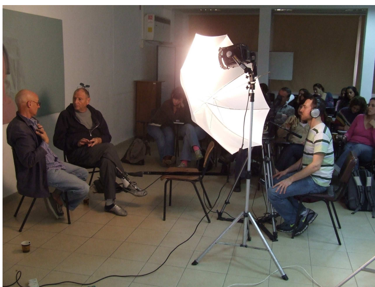
יום מרה בראיון מצולם עם סטודנטים