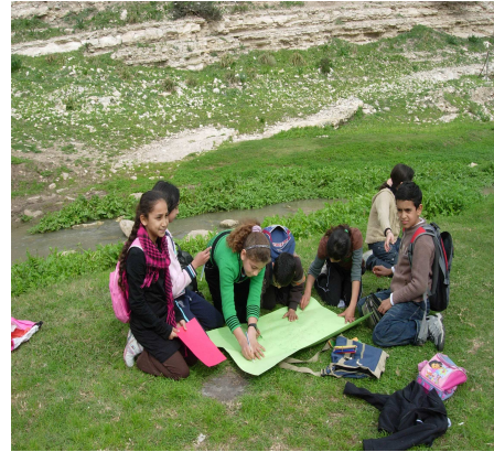
פעילות תלמידים מכעביה וראס עלי בנחל ציפורי