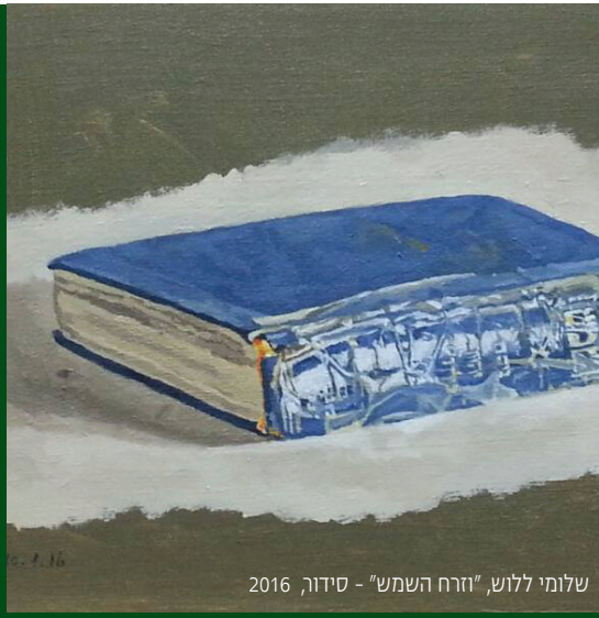
שלומי ללוש, "הרח השמש" - סידור, 2016