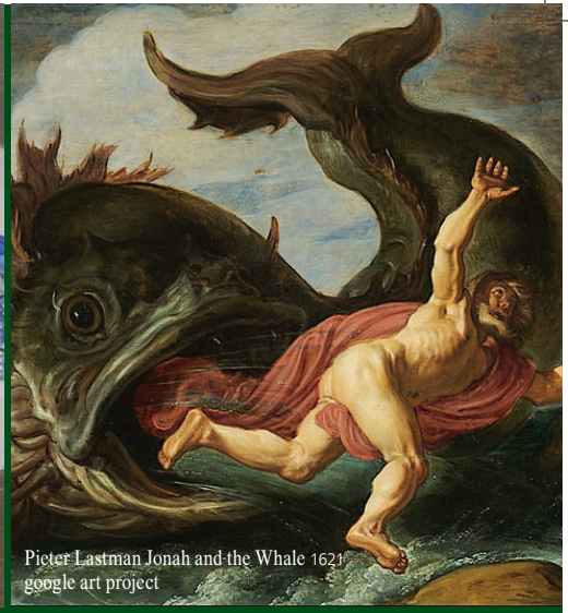
Pieter Lastman Jonah and the Whale 1621 google art project