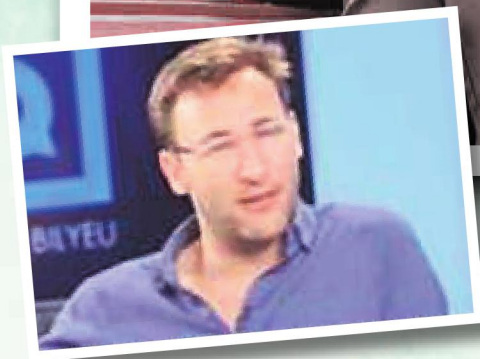
סיימון סינק בסרטון שעורר את המהומה