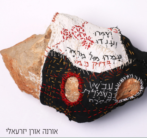
אורנה אורן יזרעאלי