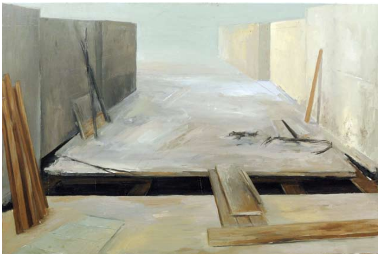
יהודה יציב, אחרי גלעד אופיר, 2007-8, שמן על בד, 150x120