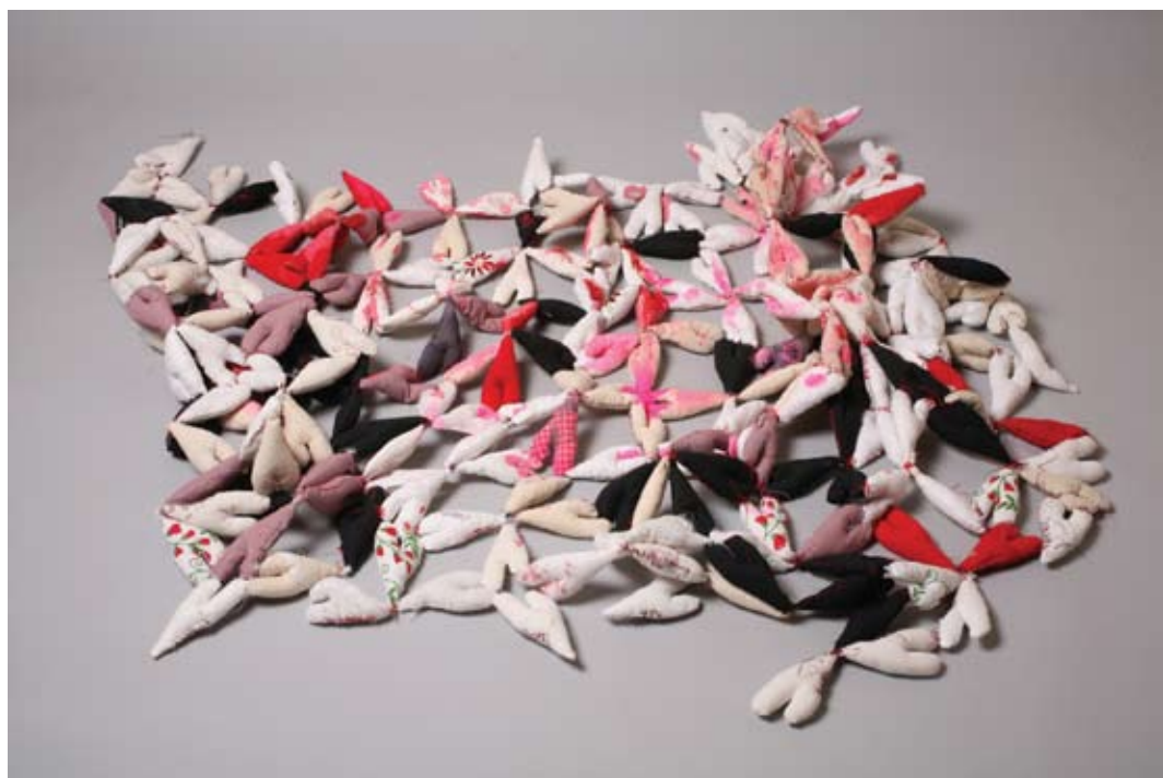
למעלה: רוני רימון, תכשיט תודעה מרחפת, 2007, כפתורים וחוטים מחומרים שונים, 120x87x48 למטה: רוני רימון, DNA, 2007, טכניקה מעורבת, 300x160x4