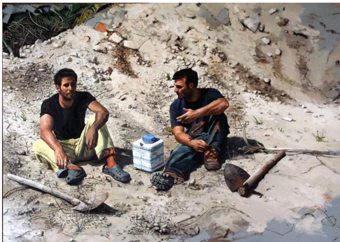
מתן בן כנען, מנוחה, 2008, שמן על בד, 145x160