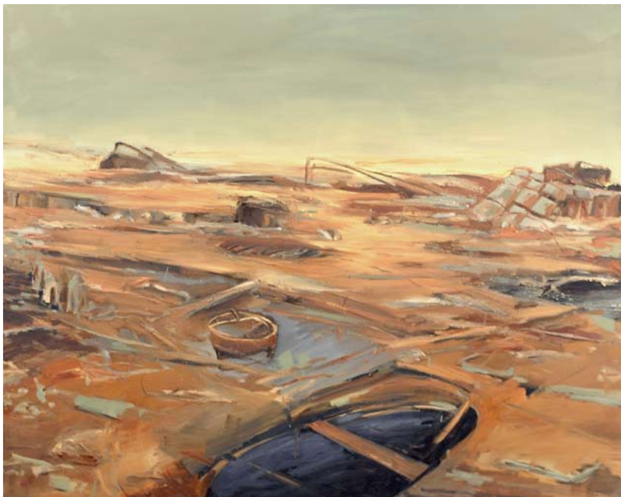
יהודה יציב, מתוך הסדרה 'טבע דומם', 2007-8, שמן על בד, 150x120