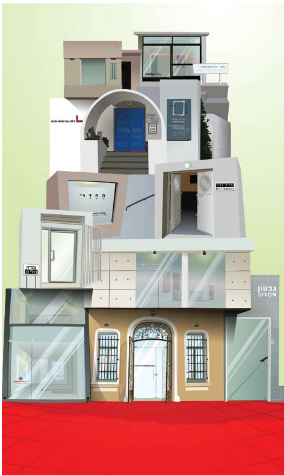
ג'ני וינשטיין, מגדל בבל, מתוך סדרת 'שומרי הסף', 2007, מדיה דיגיטאלית, 120x200