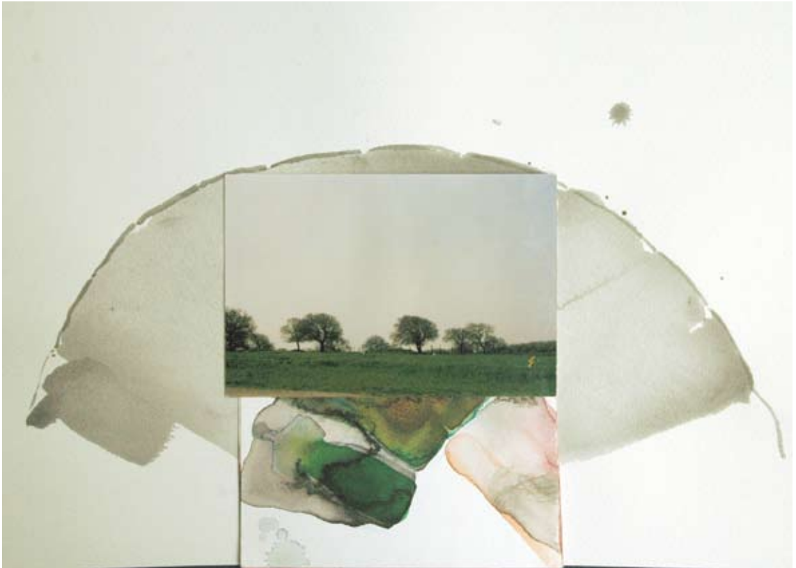
דורית רינגרט, מניפה, טכניקה מעורבת על נייר, 36x26