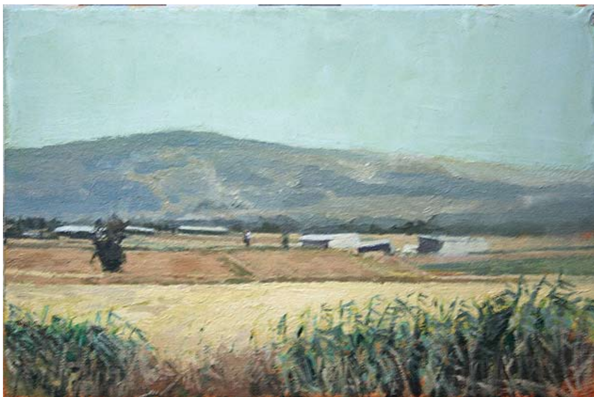
מתן בן כנען, נוף עם אקליפטוס, 2006, שמן על בד, 30x20