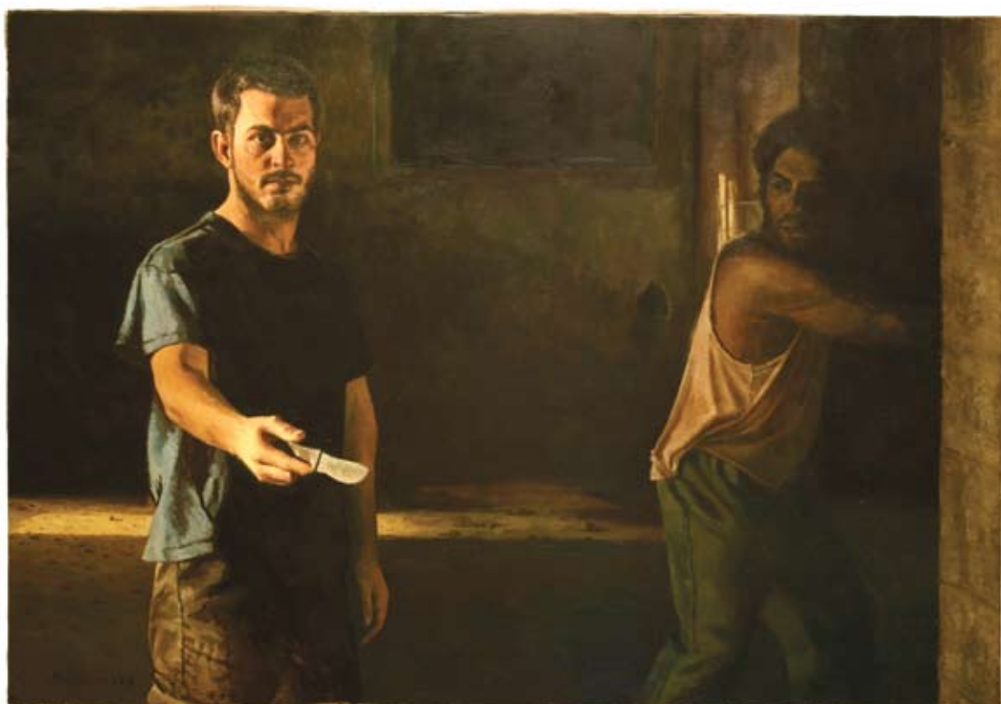
מתן בן כנען, ללא כותרת, 2007, שמן על בד, 130x90