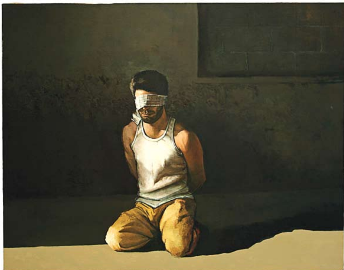
מתן בן כנען, שב"ח/שמשון, 2007, שמן על בד, 145x115