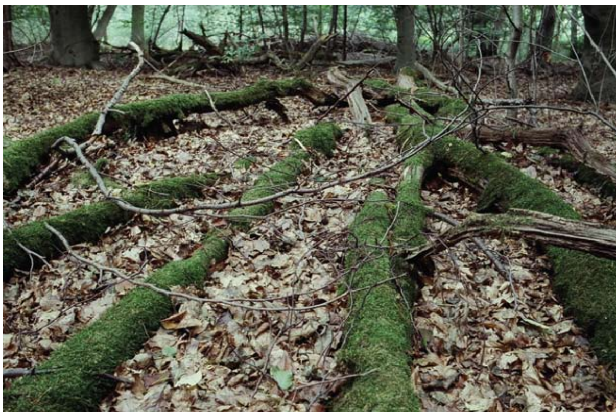
טלי כהן גרבוז, מתוך סדרת 'טבע רוחש רע', 8-2007, צילום בפילם 35 מ"מ