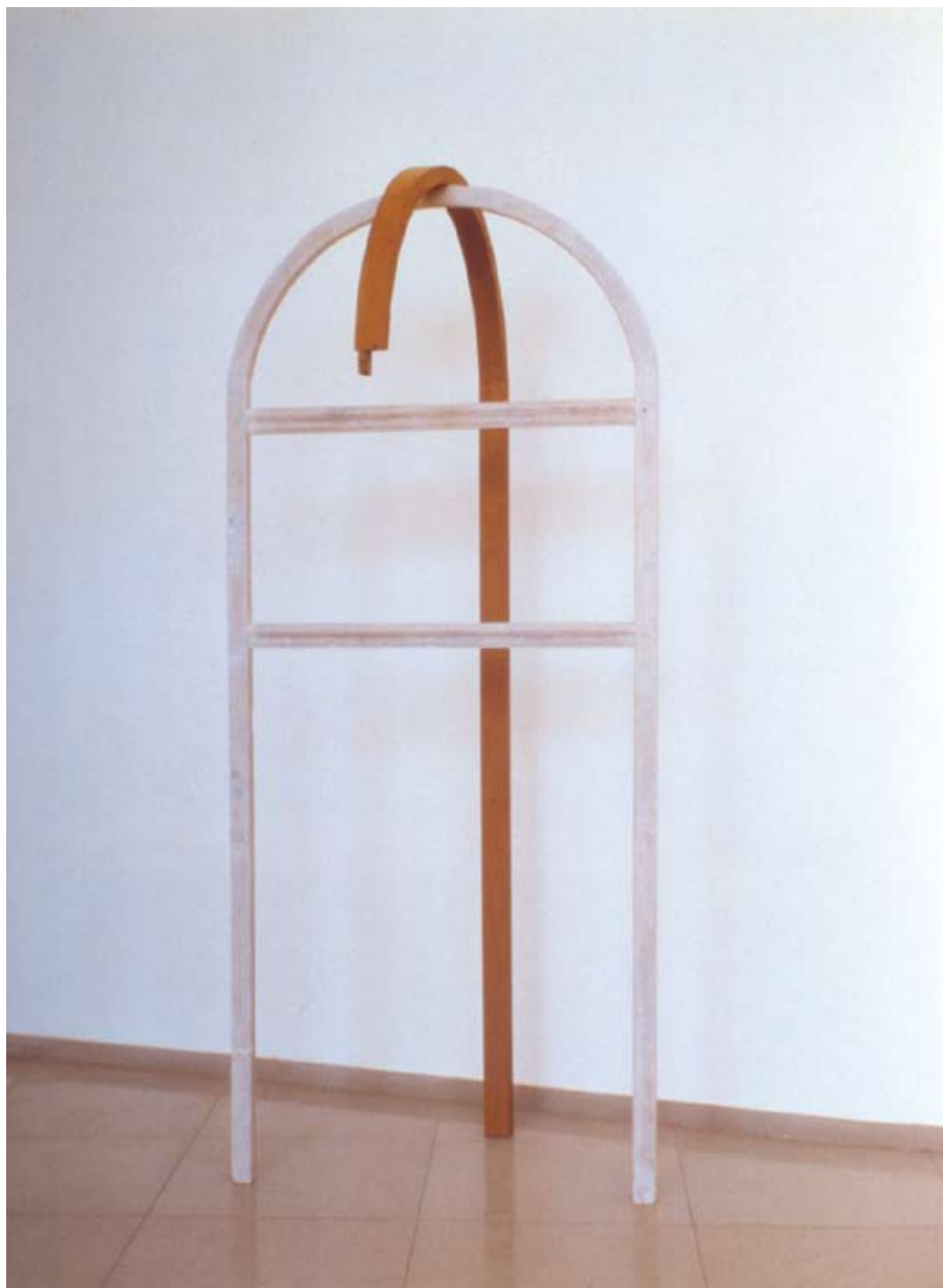
מיכאל גרוס, קשתות ירושלמיות, 1988, עץ צבוע, 97x98.5x233