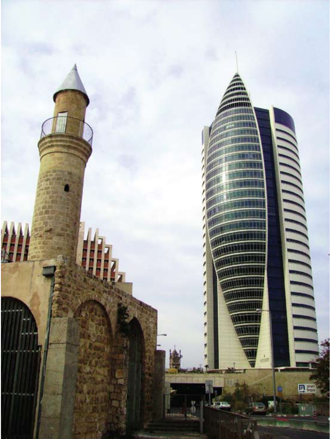
אחלאם בסול, חיפה, 2007