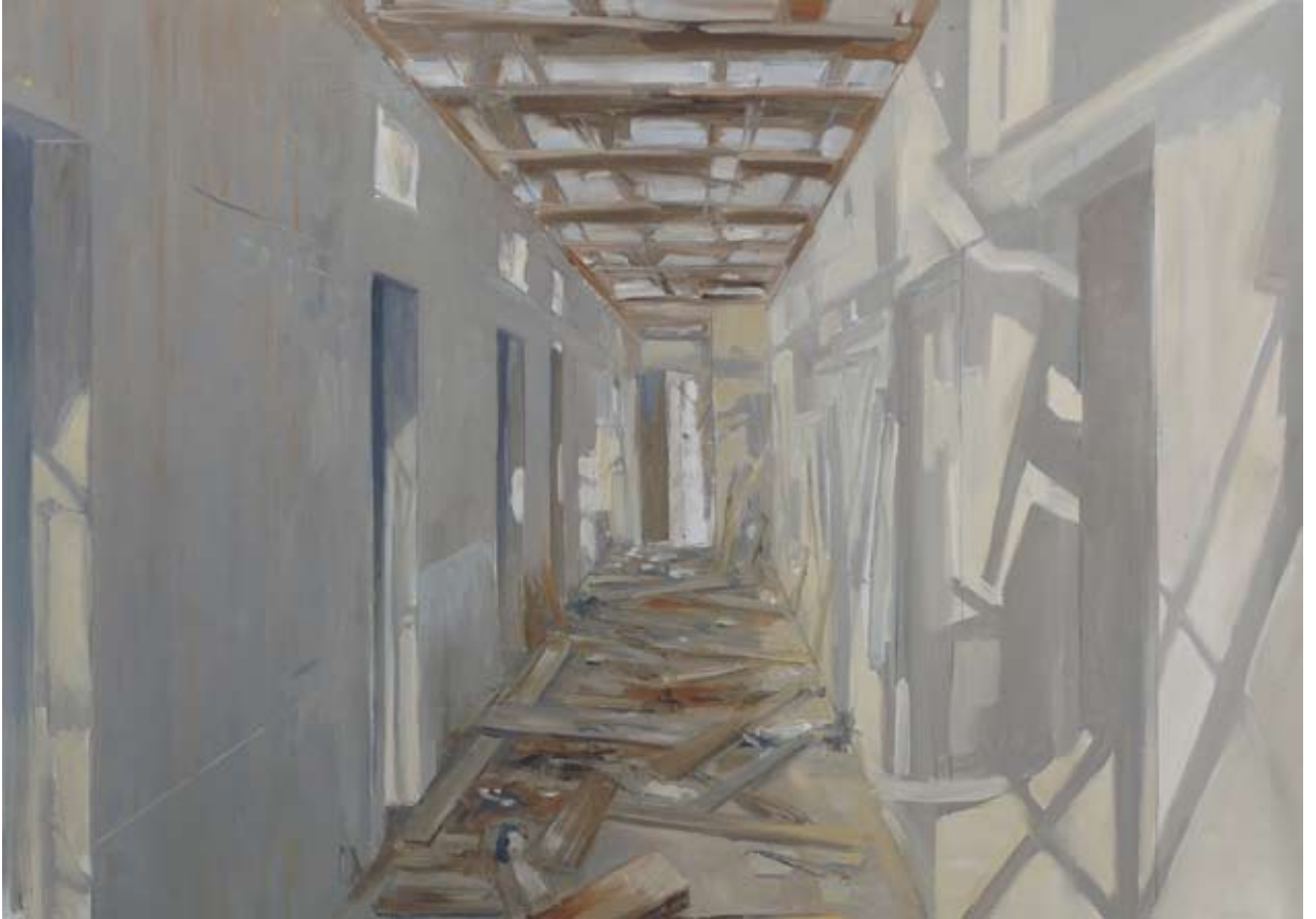
יהודה יציב, מתוך הסדרה 'טבע דומם', 2007-8, שמן על בד, 120x90