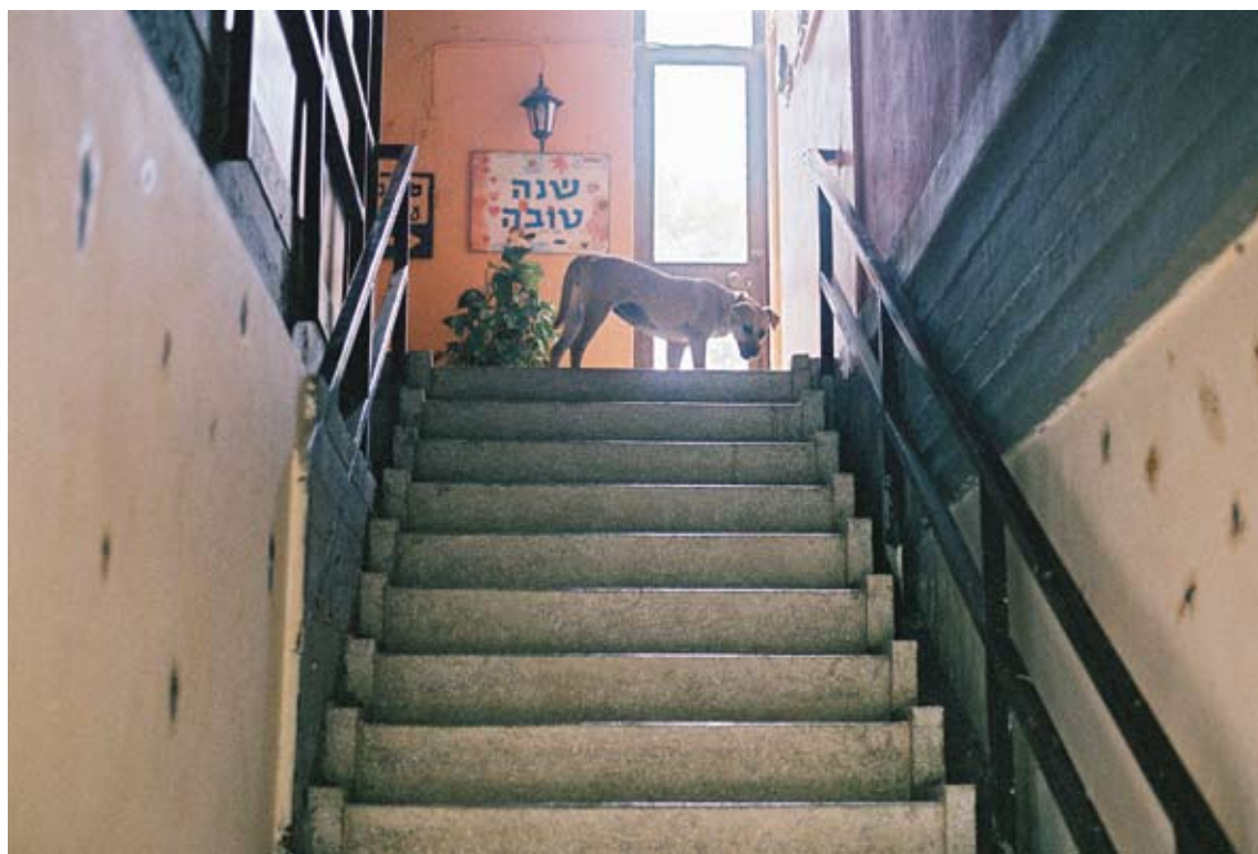
טלי כהן גרבוז, מתוך סדרת 'Dog Day' 8-2007, צילום בפילם 35 מ"מ