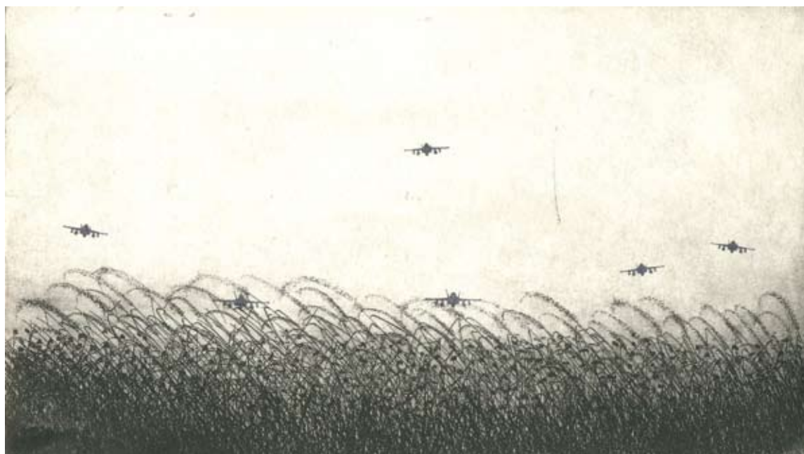
פריד אבו שקרה, מתוך סדרת 'נופי הארץ', 2008, תצריב קו וחותרמות, 20x15