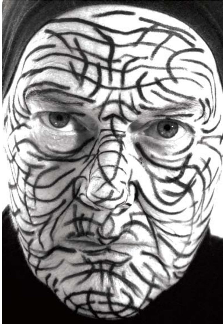
דליה מאירי, קווים, מתוך עבודת וידאו, 2008