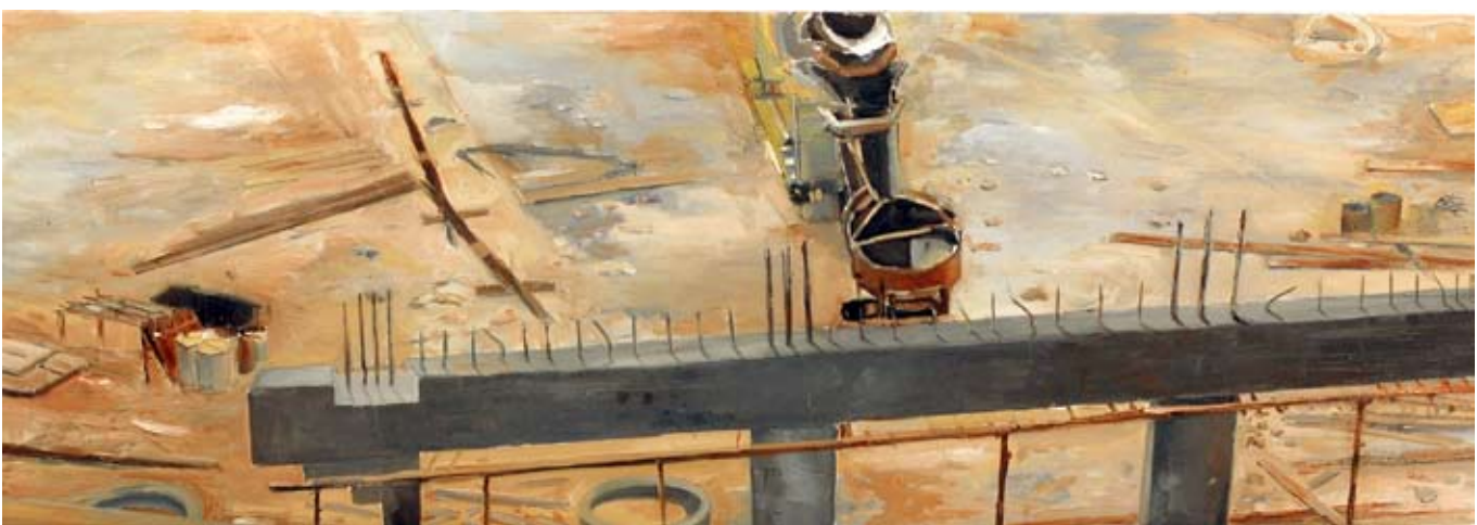
יהודה יציב, מתוך הסדרה 'טבע דומים', 8-2007, שמן על בד, 135x160