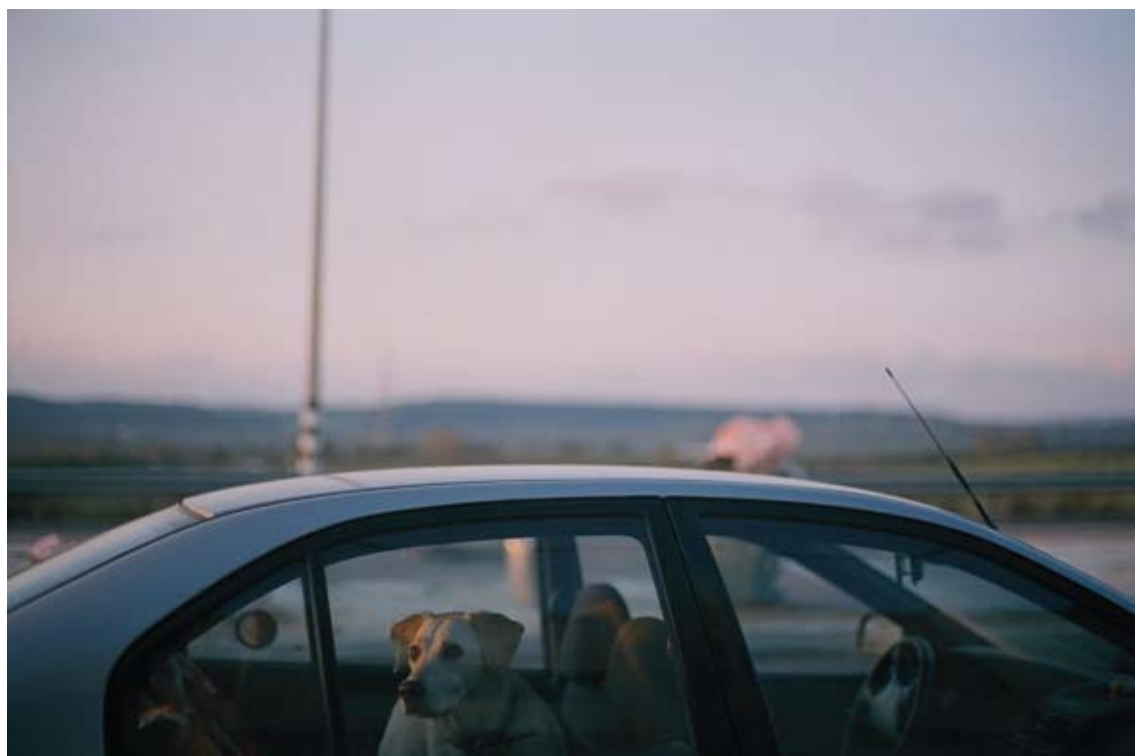
טלי כהן גרבוז, מתוך סדרת 'Dog Day' 8-2007, צילום בפילם 35 מ"מ