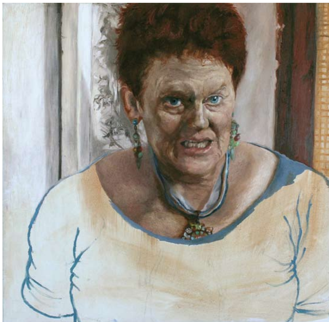
נג'ואן זועבי, דיוקן דליה מאירי מתוך סדרת 'מורים', 2008, שמן על בד, 60x60