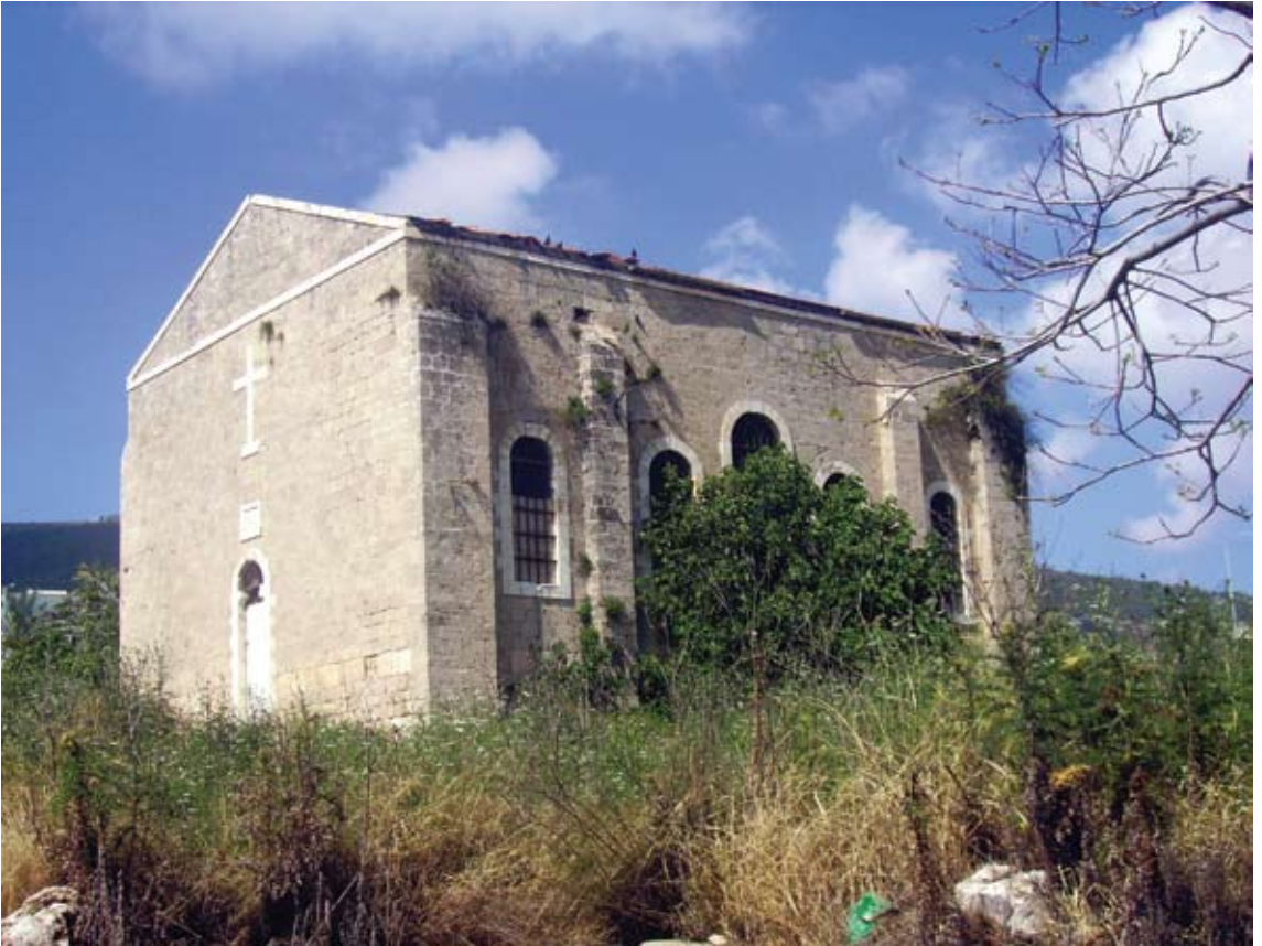
אחלאם בסול, כפר אלבסה, 2007