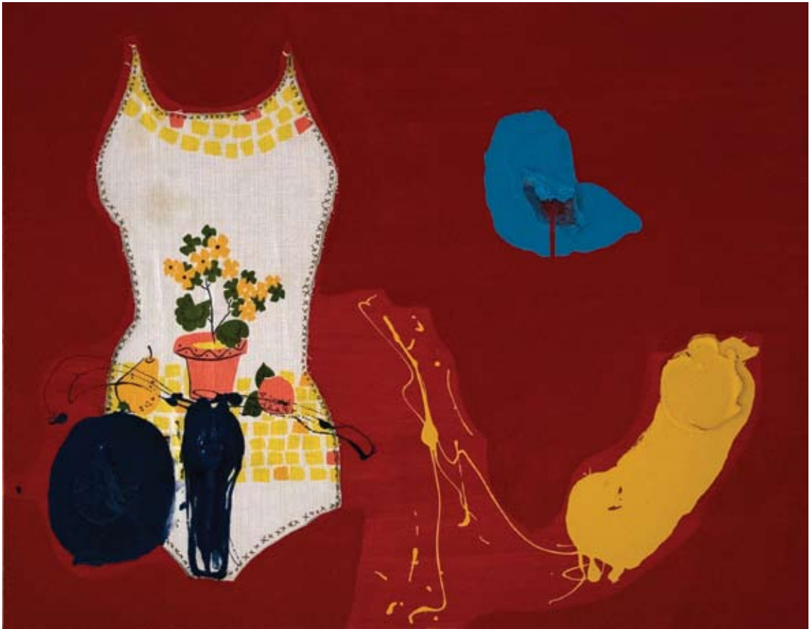
אפרת לוין, ללא כותרת, 2007, טכניקה מעורבת על בד, 90x70