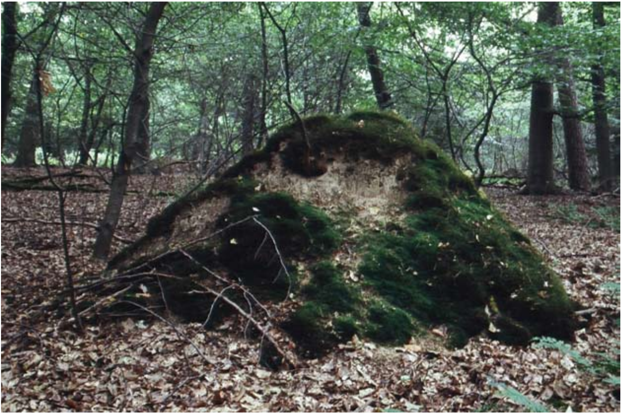
טלי כהן גרבוז, מתוך סדרת 'טבע רוחש רע', 8-2007, צילום בפילם 35 מ"מ