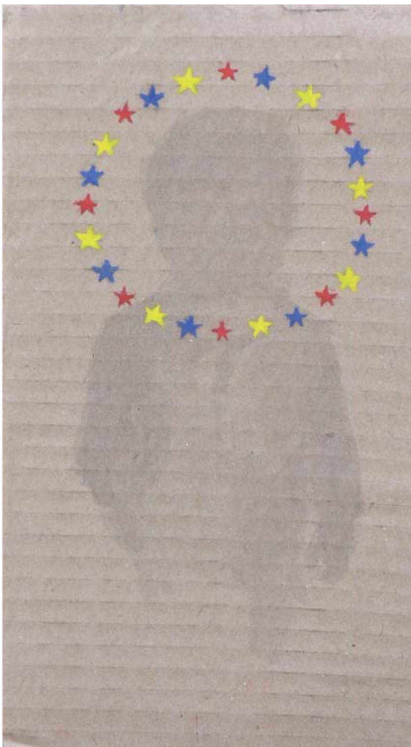
אלה קריגר, ללא כותרת, 2008, דיו וצבע שמן על קרטון, 27x13.5