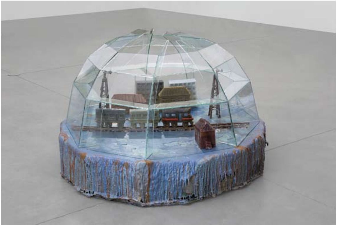
אלינה רום־כהן, סביבה [רכבת], 2008, טכניקה מעורבת, 105x45 מתוך תערוכת: 'הבתים שבבית גרים בדירות'