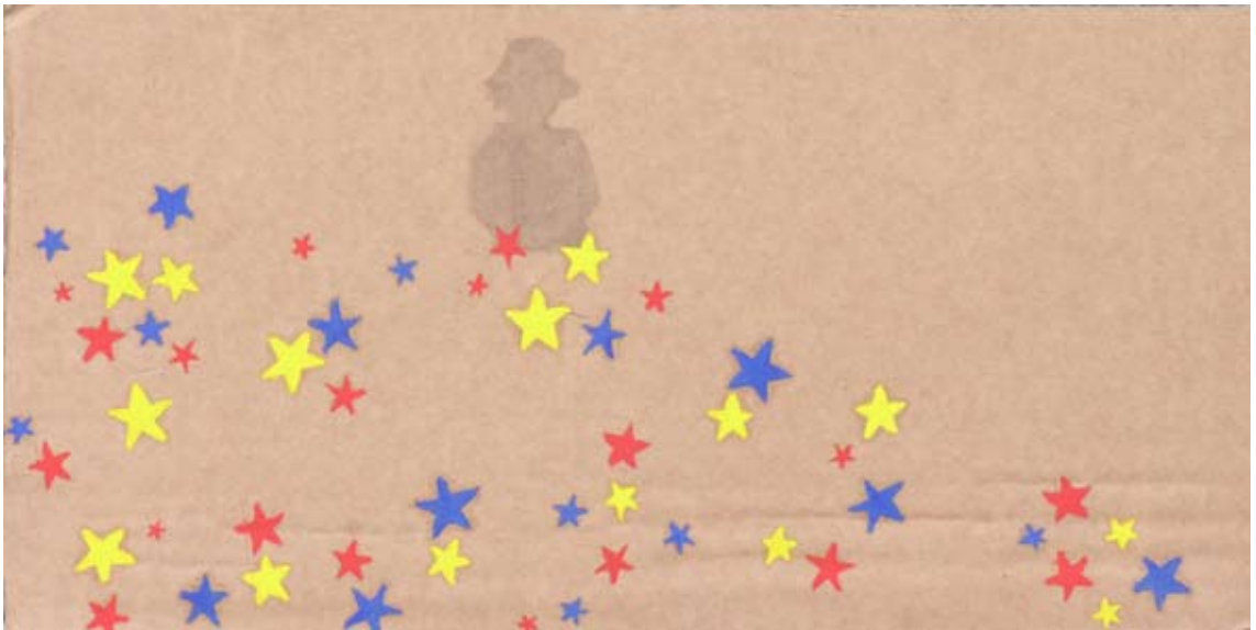
אלה קריגר, שדה כוכבים, 2008, דיו וצבע שמן על קרטון, 27x13.5