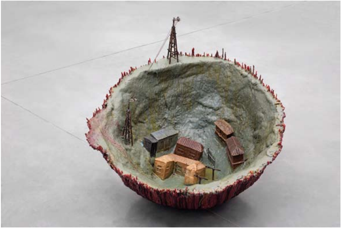
אלינה רום-כהן, סביבה [עיירת דייגים], 2008, טכניקה מעורבת, 88x52 מתוך תערוכת: 'הבתים שבבית גרים בדירות'