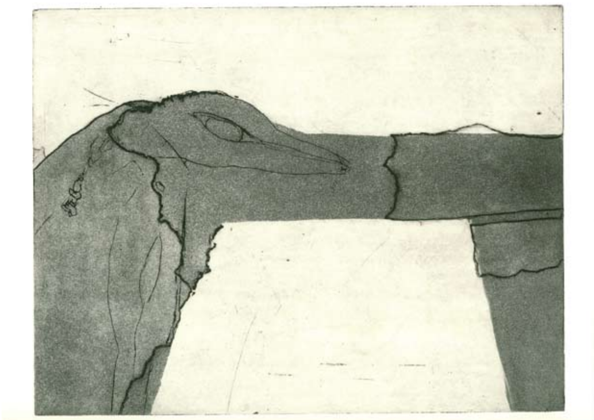
דורית רינגרט, מתוך סדרת 'אלא אנייה עומדת', 2008, תצריב קו, צריבה פתוחה ואקוויטינטה, 38x29