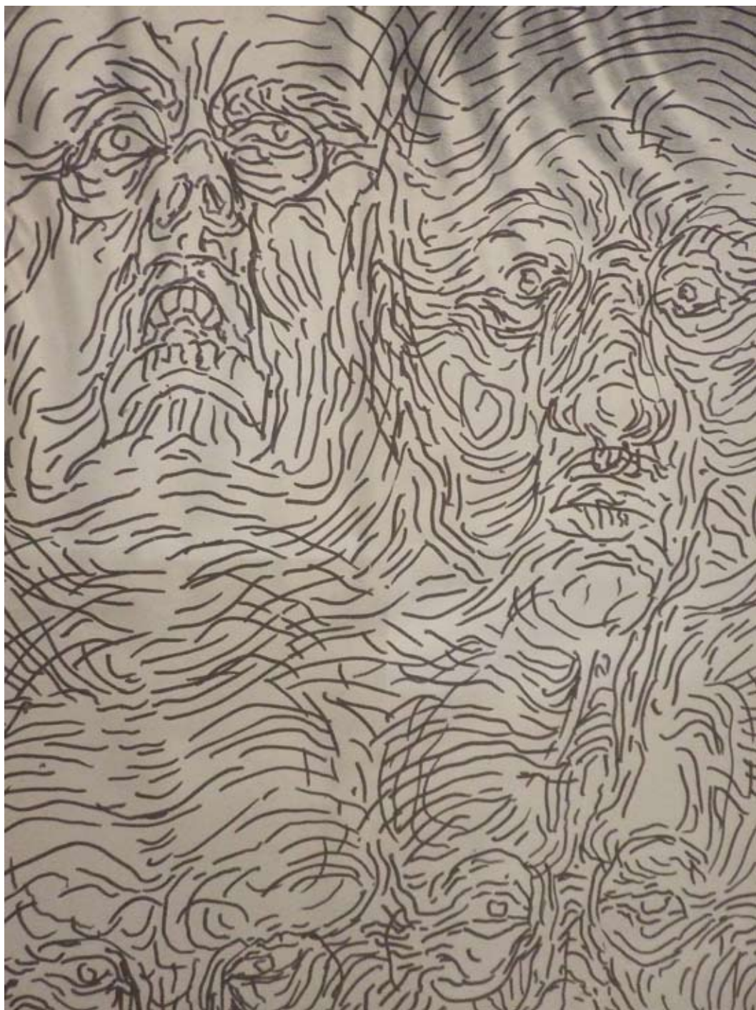
דליה מאירי, רישומי רנטגן, עט סימון על מצע אנטי סאן, 2008