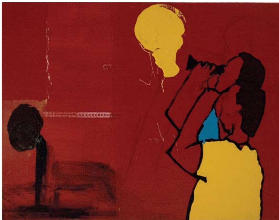
אפרת לוין, ללא כותרת, 2007, שמן תעשייתי על בד, 90x70