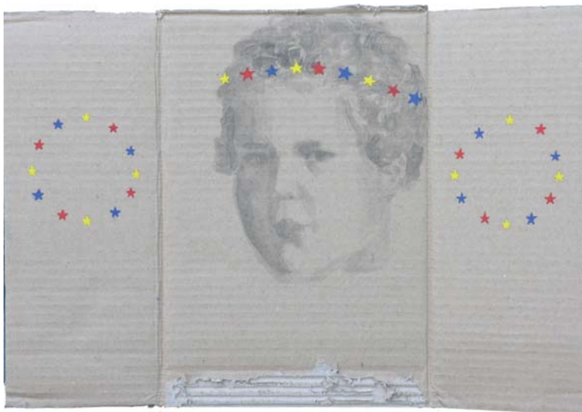
אלה קריגר, טריפטיך, 2008, דיו וצבע שמן על קרטון, 51x31