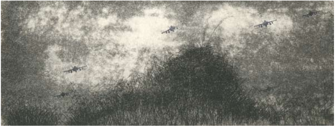
פריד אבו שקרה, מתוך סדרת 'נופי הארץ', 2008, תצריב קו וחותרמות, 20x15