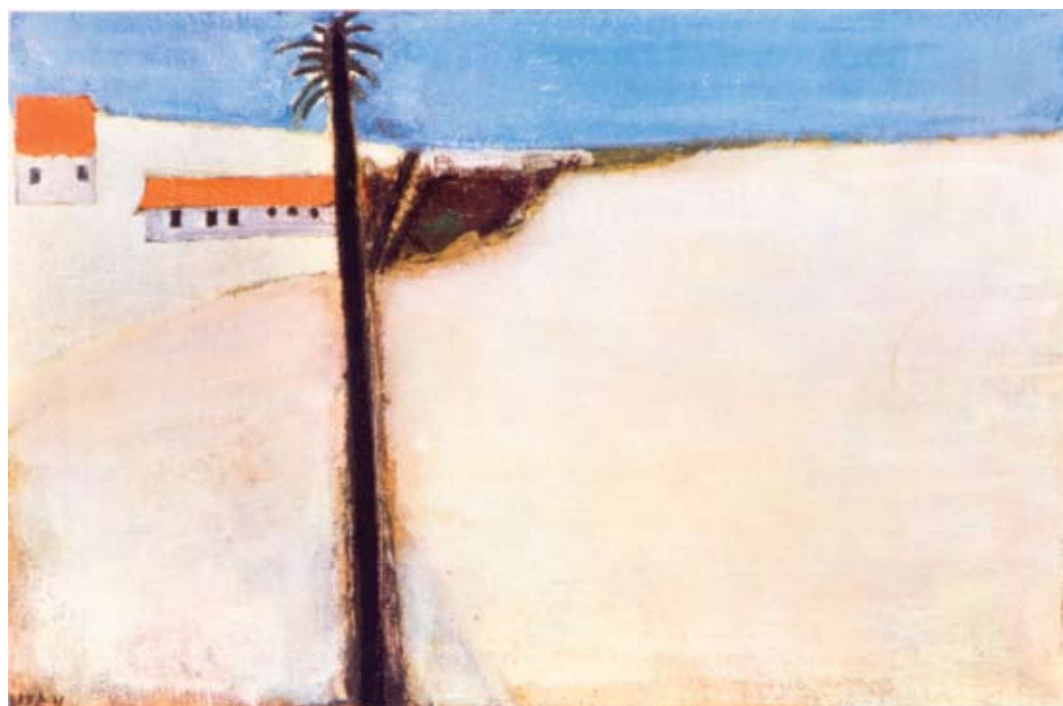
מיכאל גרוס, הבית והדקל במגדל, 1956, שמן על בד, 120x80