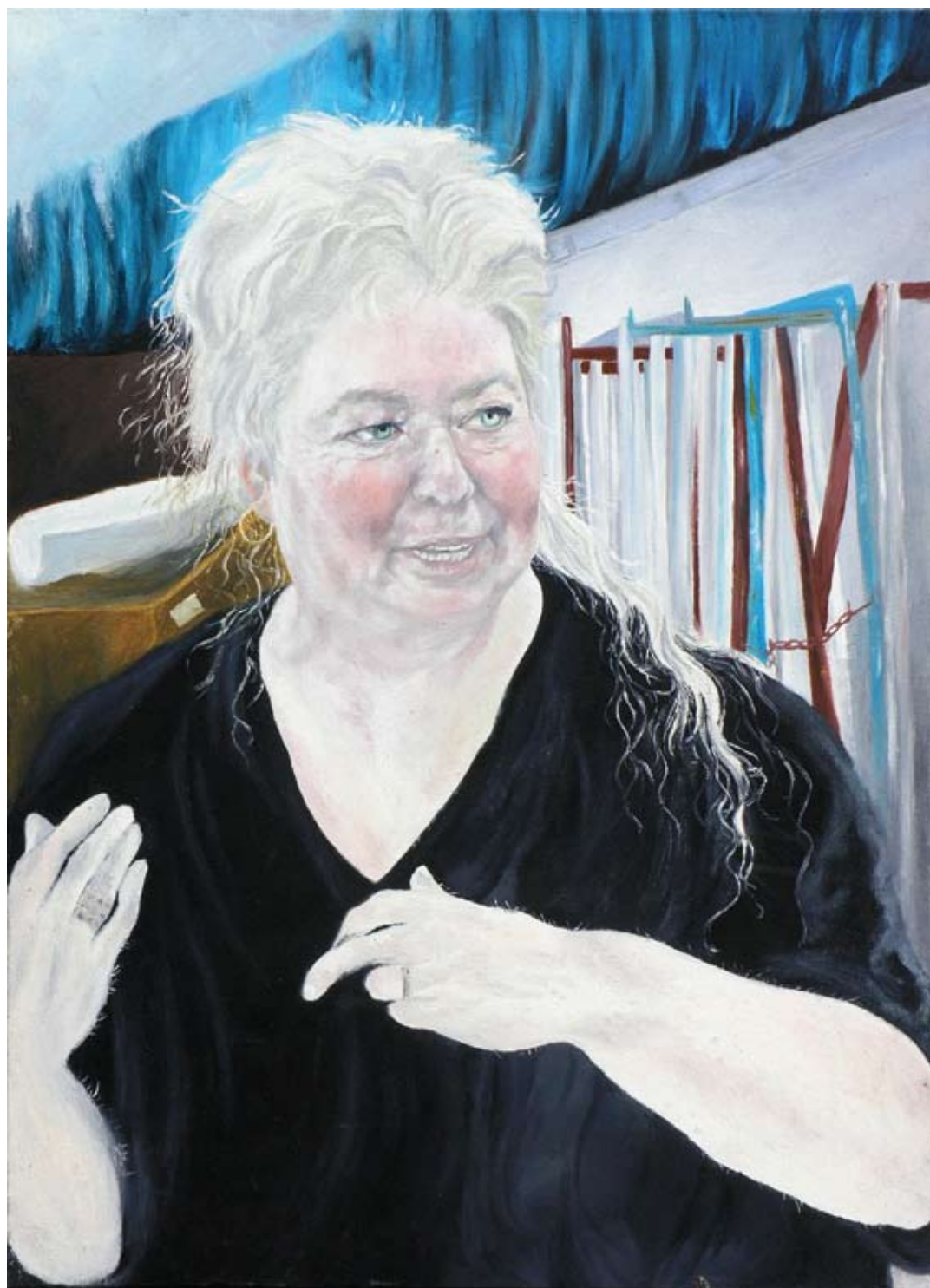
נג'ואן זועבי, דיוקן עידית לבבי גבאי מתוך סדרת 'מורים', 2008, שמן על בד, 50x70