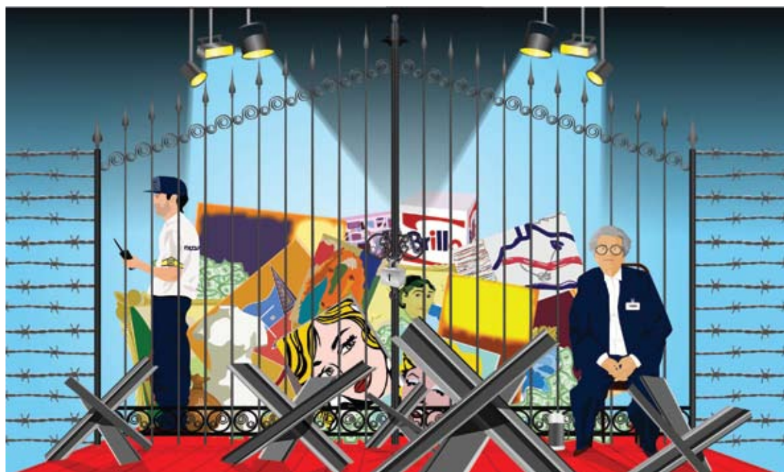
ג'ני ויינשטיין, שער, מתוך סדרת 'שומרי הסף', 2007, מדיה דיגיטאלית, 120x200