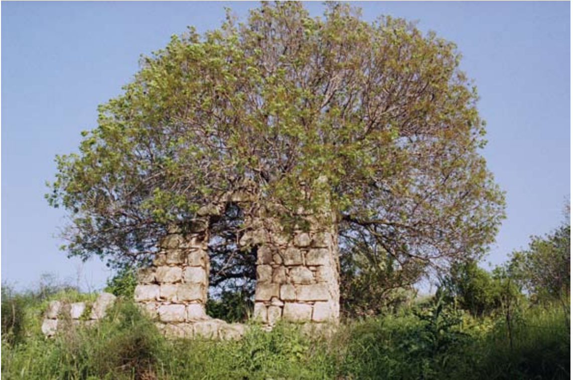
אחלאם בסול, כפר הושה, 2007