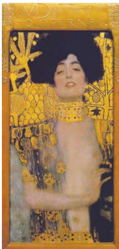
גוסטב קלימט, יהודית עם ראשו של הולופרנס, 1901, שמן על בד, 133x153

בעצם כל מה שמסביב נמצא כדי לשרת ולתמוך בנקודה הזו, היא הציר, זו רק נקודה לבנה, לא קל לראות כמוה ואולי בעצם רק אני רואה, אבל כשפתאום היא נלכדת בתוך האישון השחור מאוד, היא הופכת מראה ענקית וכל העולם נכנס בה בהרחבה, האשה הזו לגמרי נוכחת עד ששום דבר לא יזיז אותה, היא כבדה מדי, בעצם היא חור שחור זוהר מרגע שאתה מתקרב אל הטווח אי אפשר שלא להישאב לתוכו, להימחק בתוכו.