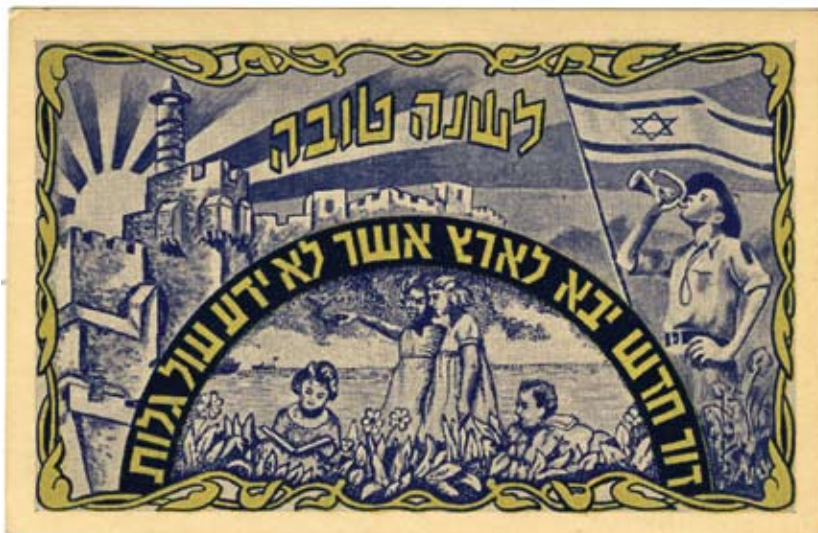
גלוית שנה טובה משנות ה-40 של המאה ה-20