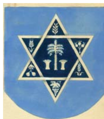
התמונות שהוצעו לוועדה, מאוספי גנזך המדינה.