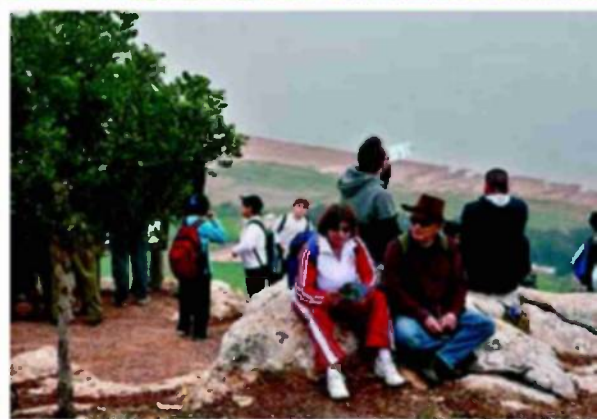
שביל אבי (למעלה). מאילת ועד למושב שאר ישוב בצפון, שם האנדרטה לזכר 73 חללי אסון המסוקים