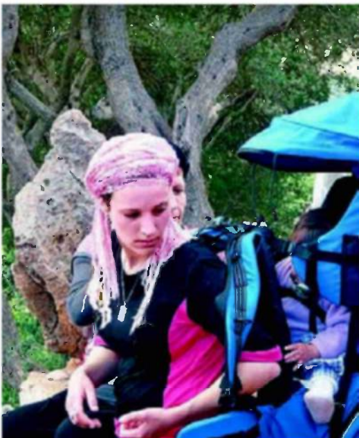
מיס אל ים. המסלול נבחר בגלל קרבתו היחסית לקרב