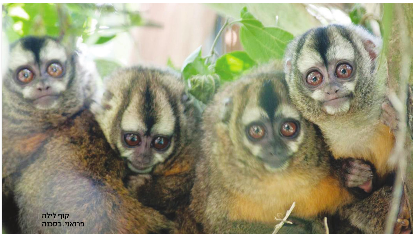
קוף לילה פרואני. בסכנה