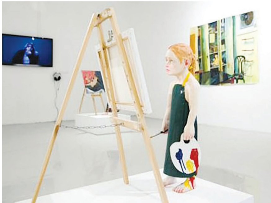
חלל הגלריה

ברומה לנשימה, מן הפנים אל החוץ ומן החוץ אל הפנים, מציעה דמות האמן/מורה מבט כפול, פנימי וחיצוני גם יחד, מבט שיש בו שותפות וגם שותפות גורל: מבט אל קרב