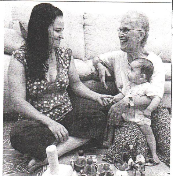
לא אורחת אלא חברה. דגנית, מעיין ורפאלה

"כל חיי עסקתי בחינוך בקיבוץ, לכל הגילאים",