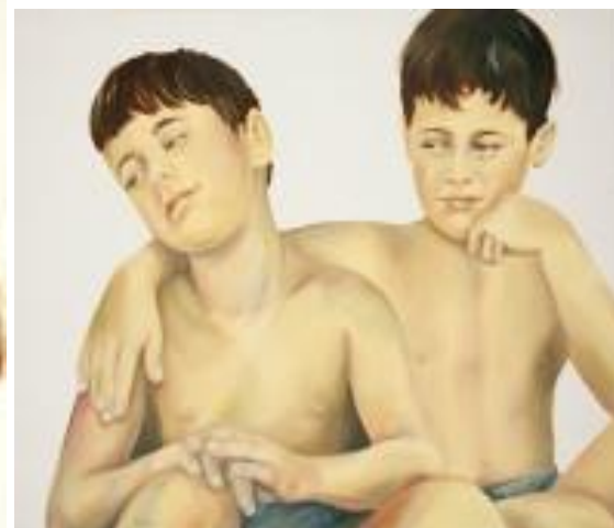
חיה גרץ רן, בניים, טכניקה מעורבת שמן על בד מודפס, 2007