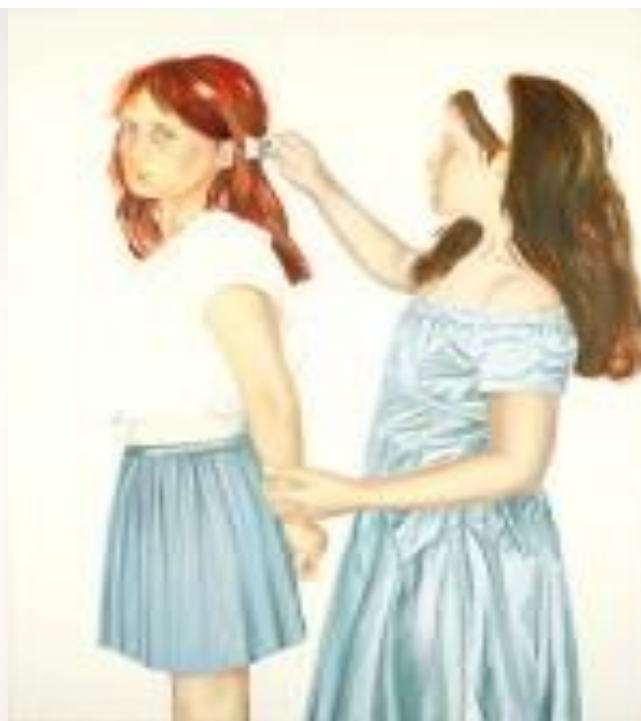
חיה גרץ רן, נועה מסרקת, שמן על בד, 2007