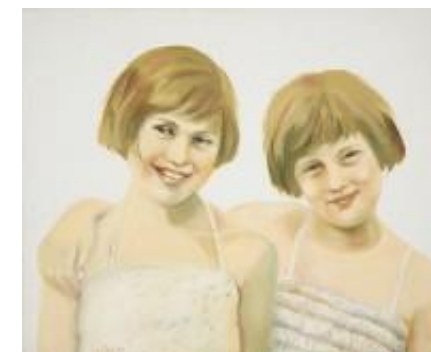
חיה גרץ רן, חברות, שמן על קנבס, 2005.