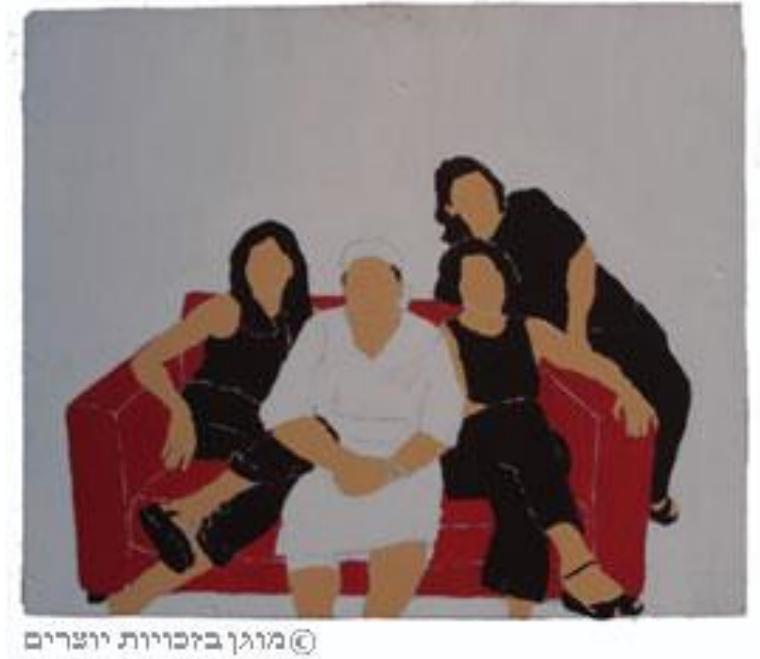
רונית צ'רניקה, אחיות 2, טכניקה מעורבת על דיקט, 2005.