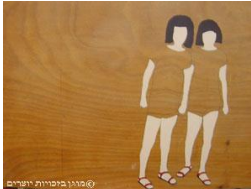
רונית צ'רניקה, אחיות 1, טכניקה מעורבת על דיקט, 2005.