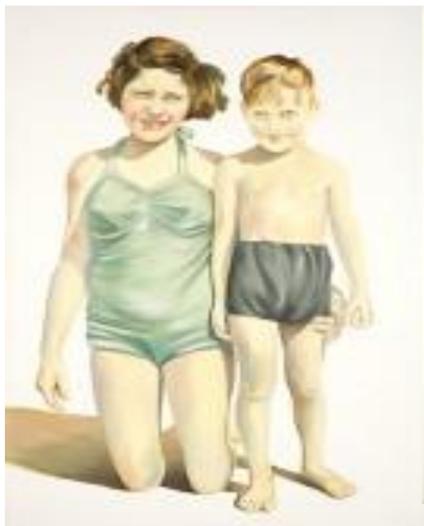
חיה גרץ רן, ציפורה ואחיה, שמן על בד, 2006