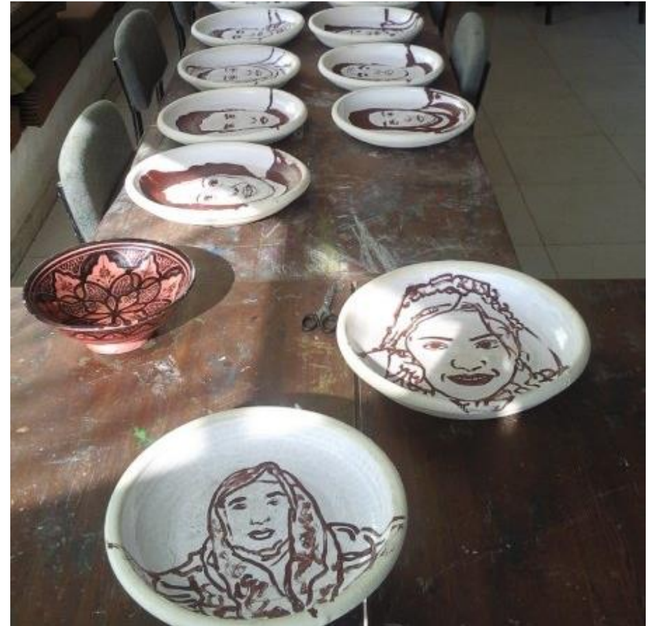
חאדר ושאח, המשפחה, 2010, צבע על צלחות חרס, שולחן עץ