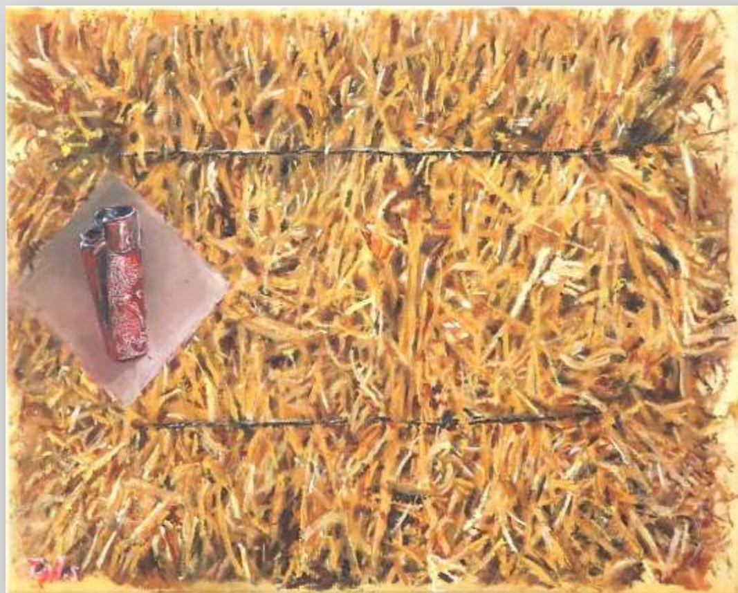
טל שרמן / הסוללים