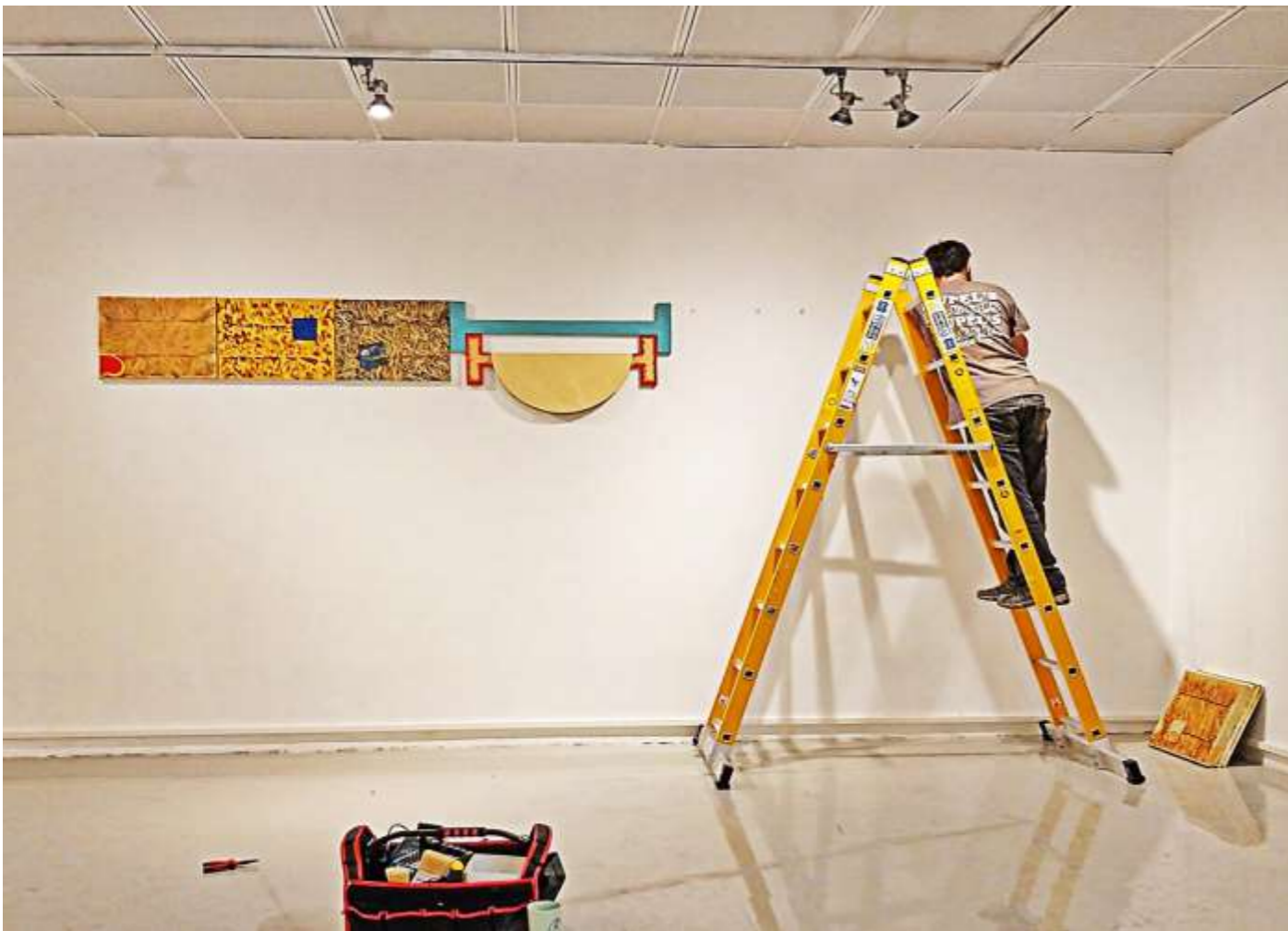
הקמה: ג'וש גלדצהלר