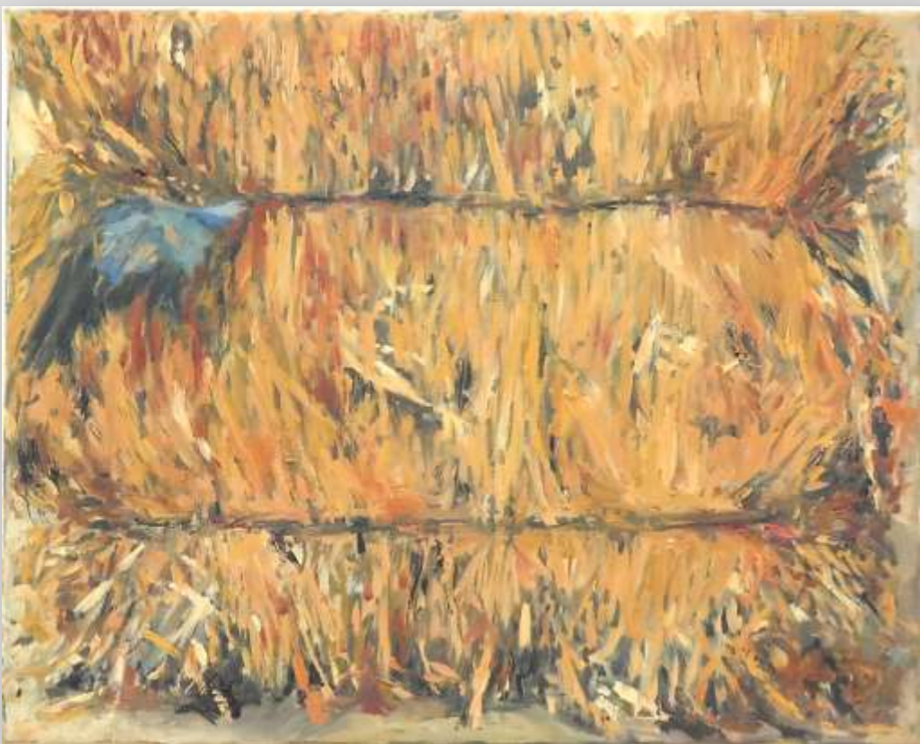
נורית רימון / קריית סבעון