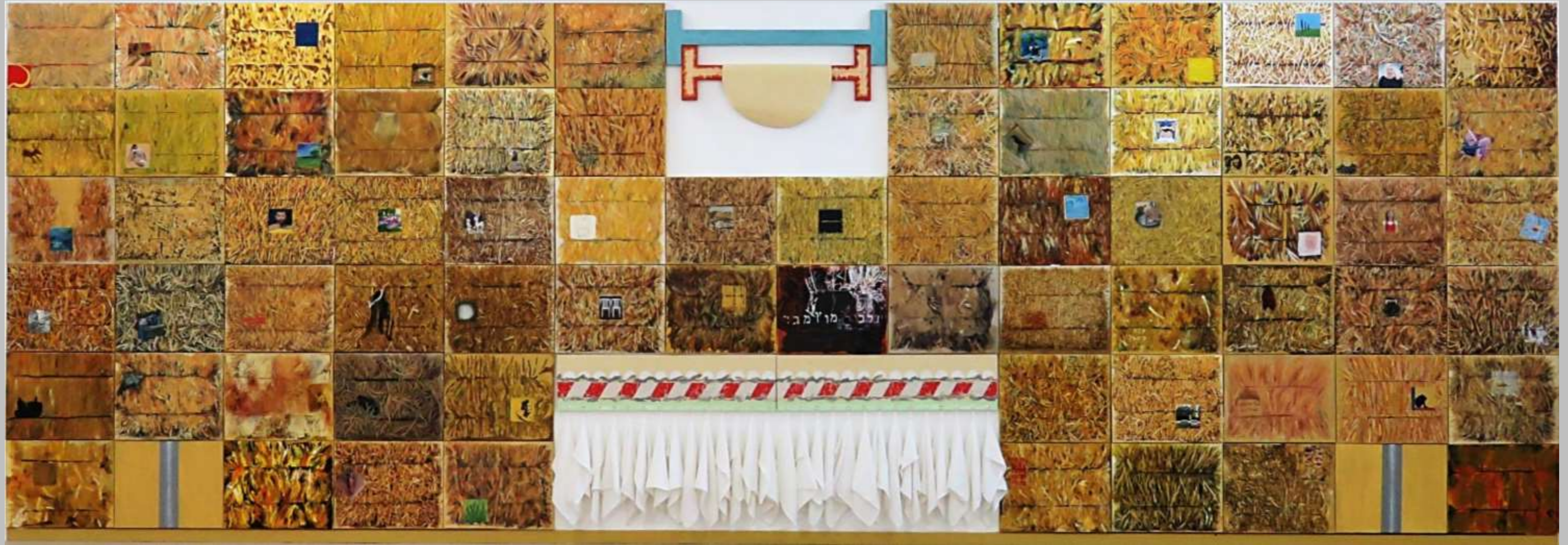
עידית לבבי גבאי, מתבן 1, הצבה בגלריה בכפר יהושע, מאי 2018, 70 ציורים + אלמנט מגבות + אלמנט סרגלים ושמש, 2.4 / 7.5 מ'