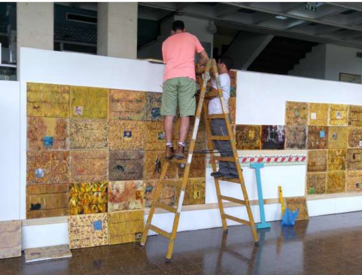
הקמה: קובי סיבוני