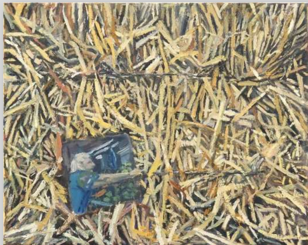
יובל פייגלין / חיפה