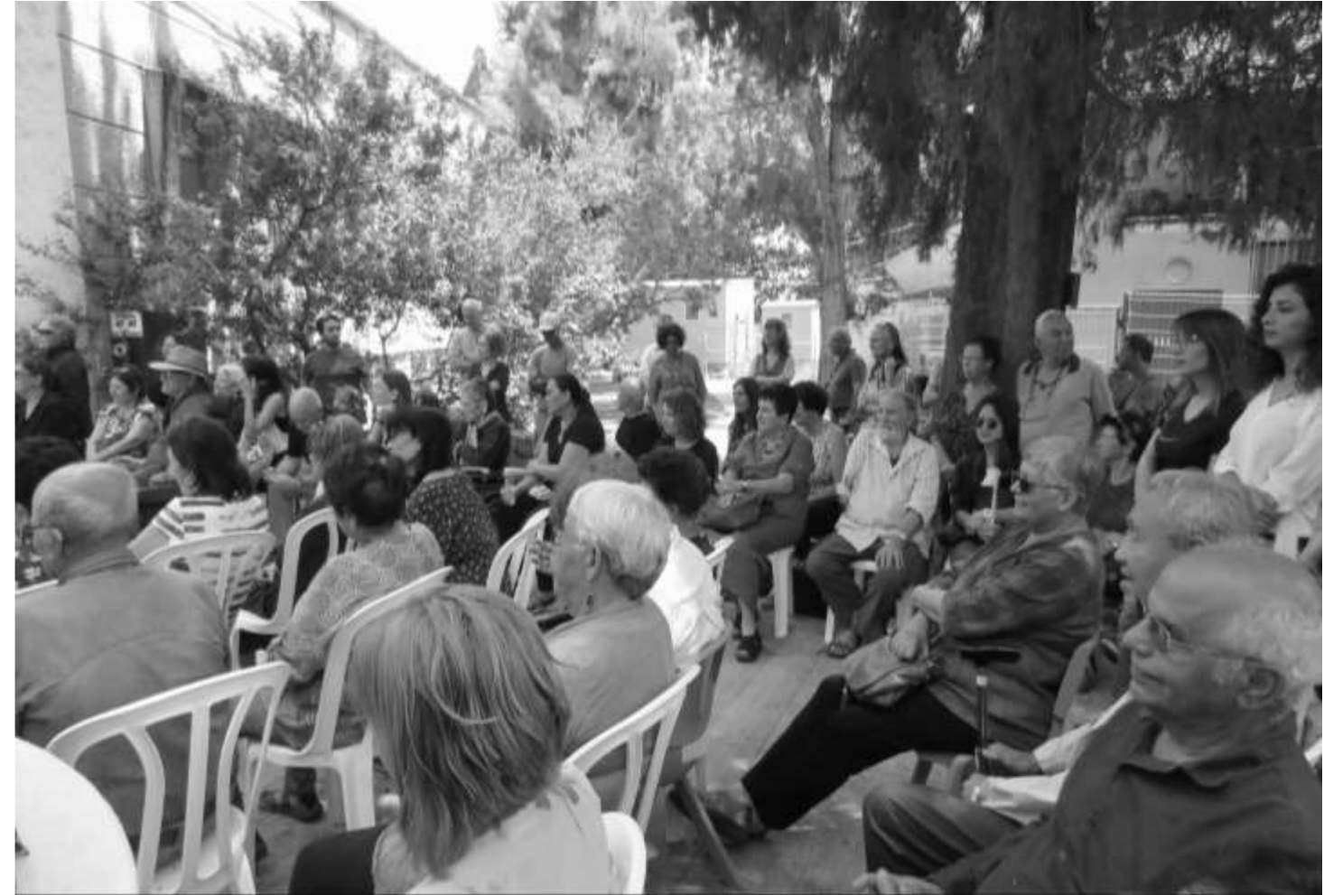
קהל בפתיחה בבית חנקין בכפר יהושע ב 11.5.2018