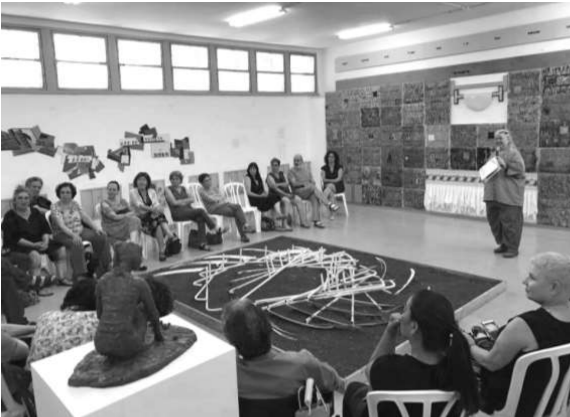
שיח גלריה בתערוכה 'גדיש' בבית חנקין בכפר יהושע