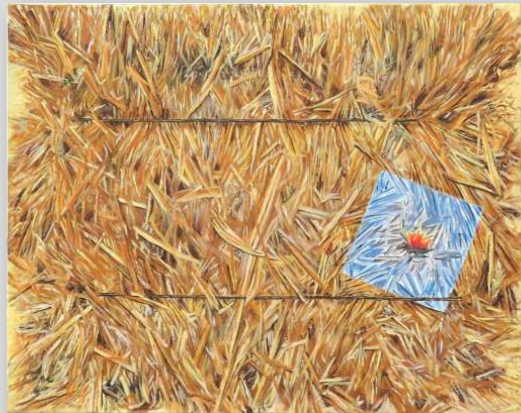
מרגרטה ברגמן / חיפה