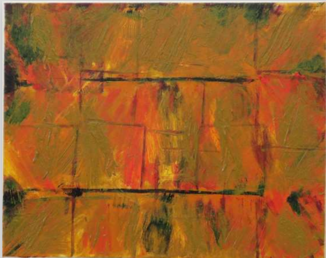
אורן בן שלמה / עפולה