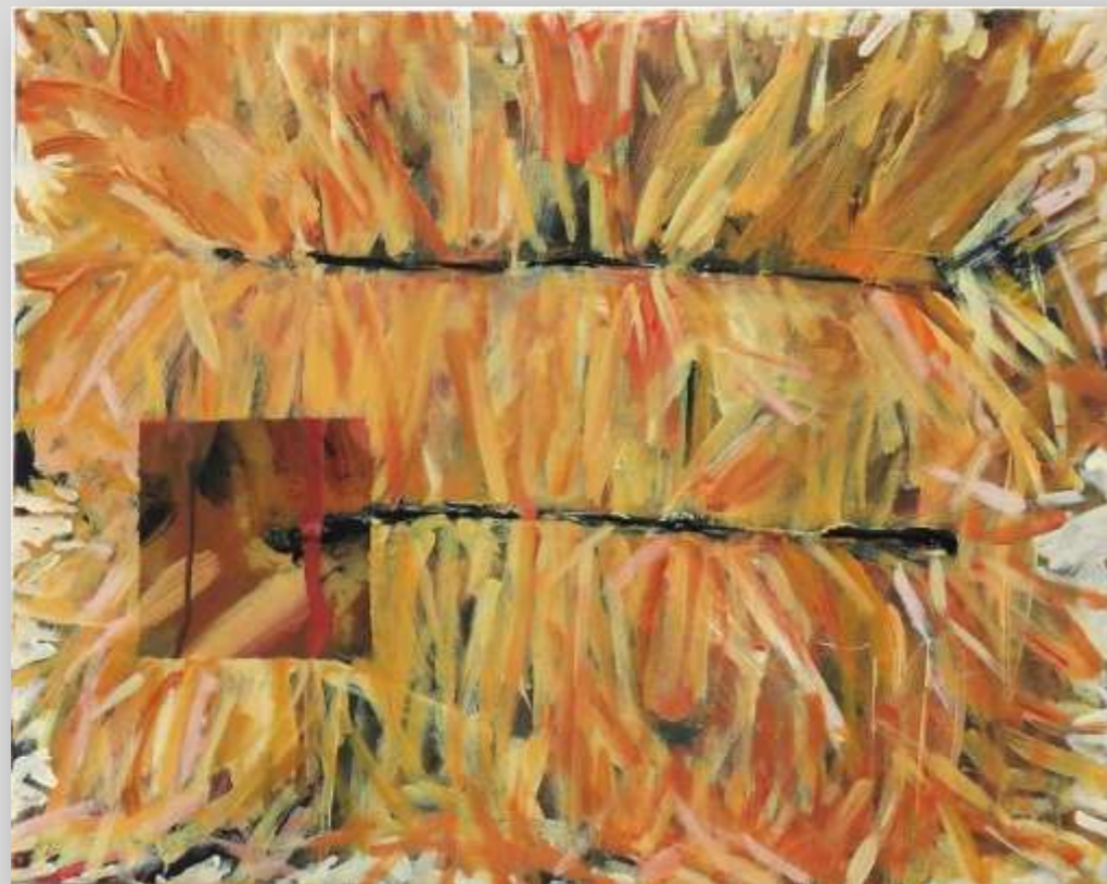
מזור רימר / חיפה