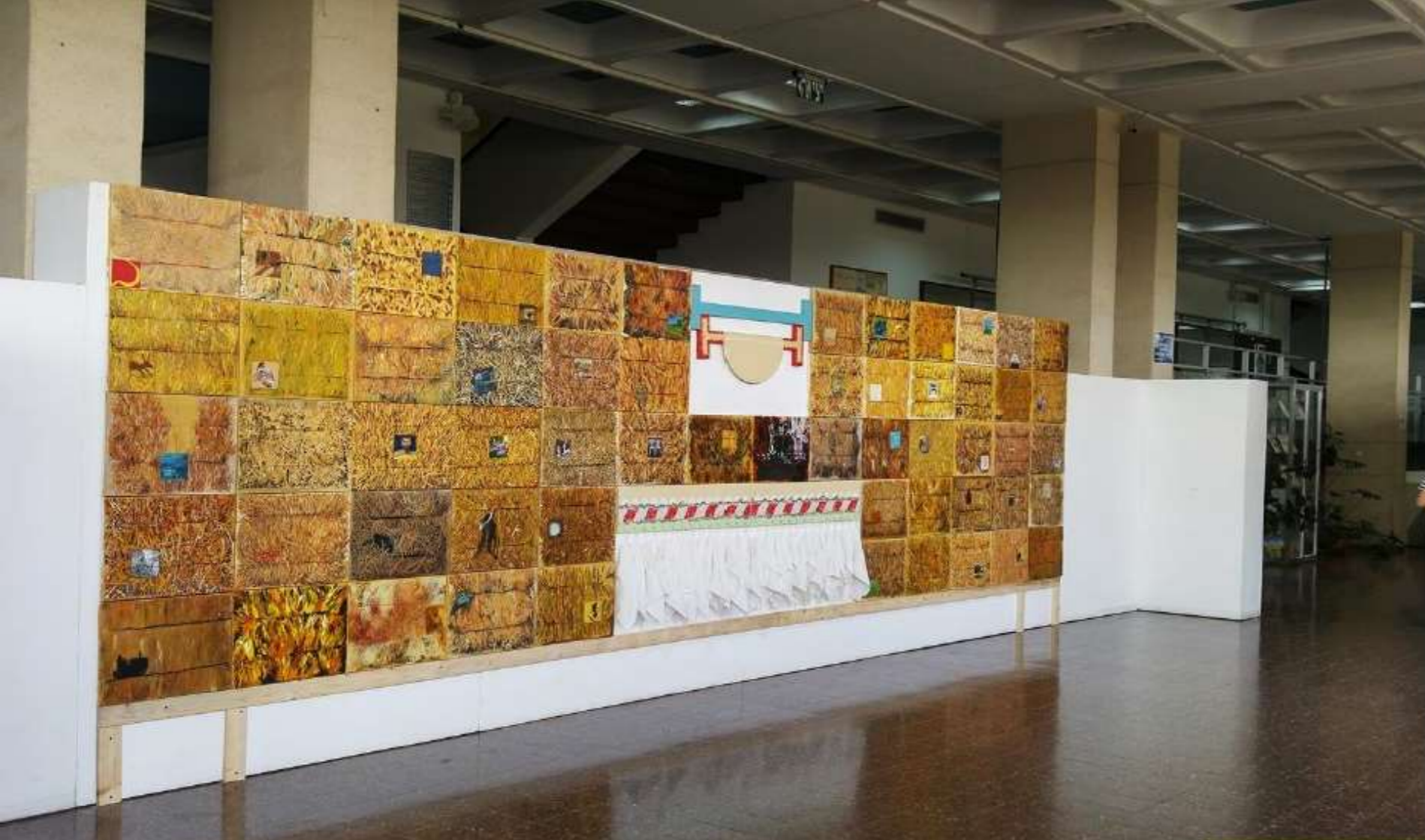
מתבן 1 | הצבה 2 | מכללת קיי | באר שבע | שני אלמנטים