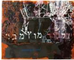
דורית רינגרט מתוך: מתבן 1