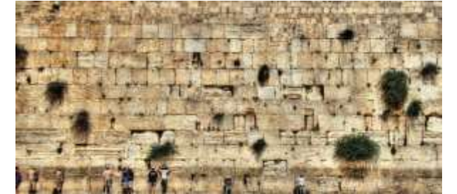
הכותל המערבי בירושלים

התגובה הראשונית שלי למראה היצירה השיתופית 'מתבן 1', קיר המרוצף ב 70 בדי קנבס, עליהם צוירו חבילות קש בצורות ובצבעים שונים, המבטאים הלכי נפש והתכוונות של האמנים שתרמו עבודתם ליצירה זו, הייתה תגובה של פליאה, הארה וחוויה כמעט דתית. בשלב זה לא הבנתי עדיין מדוע המראה הזה שמייצג אחד מתוצרי גידול הדגניים ובמיוחד החיטה, שערכו לכאורה לא גבוה, המיועד לרפד דירים ורפתות, להזנת בהמות ובשנים האחרונות לבנייה אקולוגית ומצע לגידול, מעורר בי רגש עז כל כך.