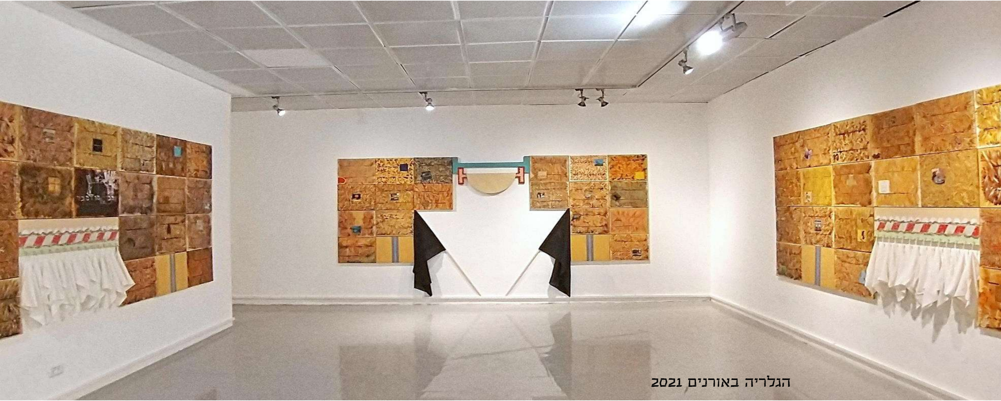
הגלריה באורנים 2021