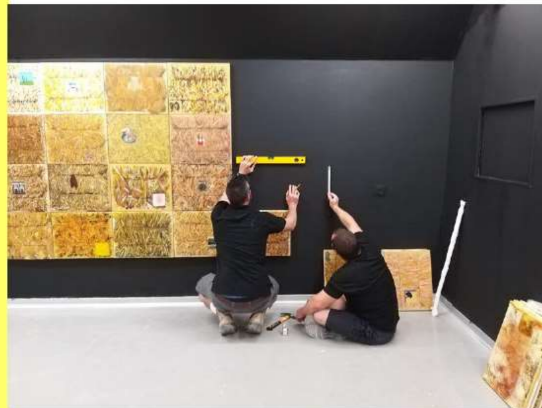
הקמה: קובי סיבוני