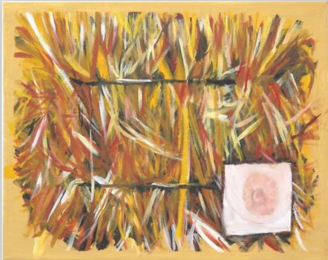
יעל קישון / קרית טבעון