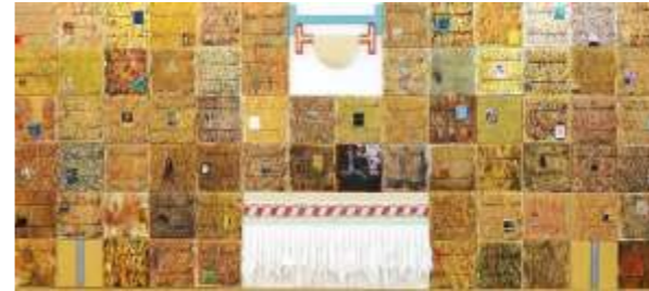
מתבן 1, בגלריה בכפר יהושע, מאי 2018

אמרתי לעצמי ולסובבים אותי שהערכים המסומלים ביצירה 'מתבן 1' עדיפים בעיני עשרות מונים על האתוס והתקווה המשיחית לבית מקדש שלישי שמייצג הכותל המערבי. וכתבתי: