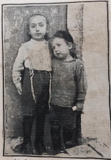
אָהר פֿם וְאָהר שאַיגו יונע לשאל

מגביהם את הקערה עם המעות ואומרים הנני טוב וזקן לקום ממנוה לספר ביציאת מצרים. לשם חזו קוב"ה ושיבתייה, על ובי' ההוא קמיר ועלם בשם קל ישראל. הא להמא ענינא די אקלו אבהתנא בארעא דמצרים. קל דקפין גימי וניכול, קל דצריך גימי ויפסח. השתא הקא, לשנה הבאה בארעא דישראל. השתא עברי, לשנה הבאה בני חורין.