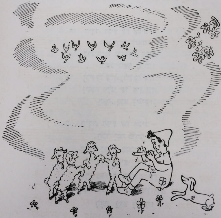
מתוך 'חגי', סיפורי חג לילדים, הוצאת טברסקי, תל אביב, 1949. השירים לוי קיפניס, אירים נחום גוטמן.

הידר, הגיע צת אביב / זקר קט. סן לי זד / עמש אור זוכסת קה.