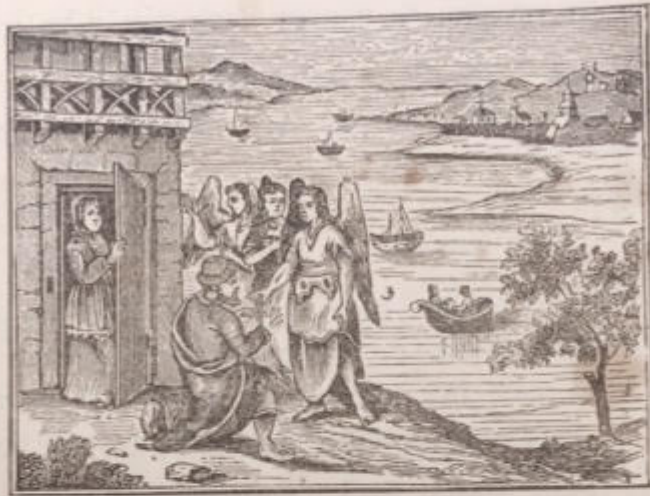
ויסא עניו וירא והנה שלשה אנשים נצבים עליו