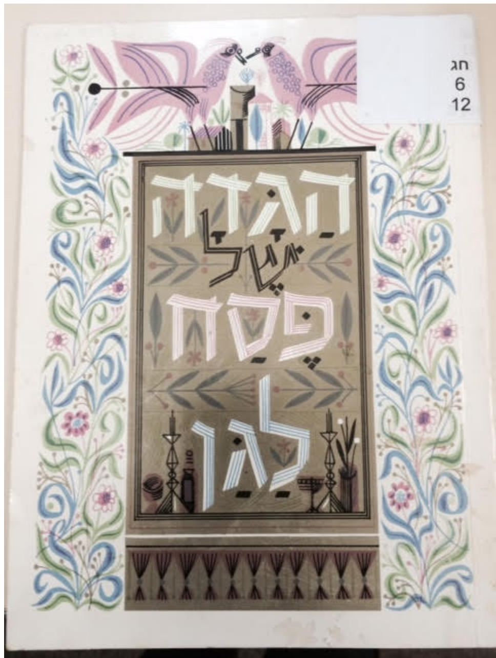
הגדה של פסח לגן, הוצאת מדור הגנים הבין-קיבוצי, תשמ"ג 1983.