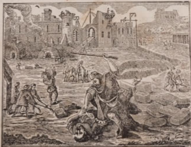
ויעבר אברם בארץ

הגדה של פסח, מצוירת עם באור עברי חדש, תרצ"ה, התחייה חברה להדפסה ירושלים.