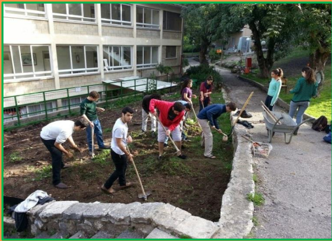
בונים גינה קהילתית במעונות אורנים