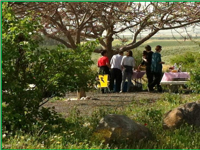
מפגש בתכנית "בשביל קהילה" בשביל עמק המעיינות