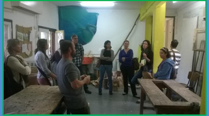
משתתפי הקורס בסדנה