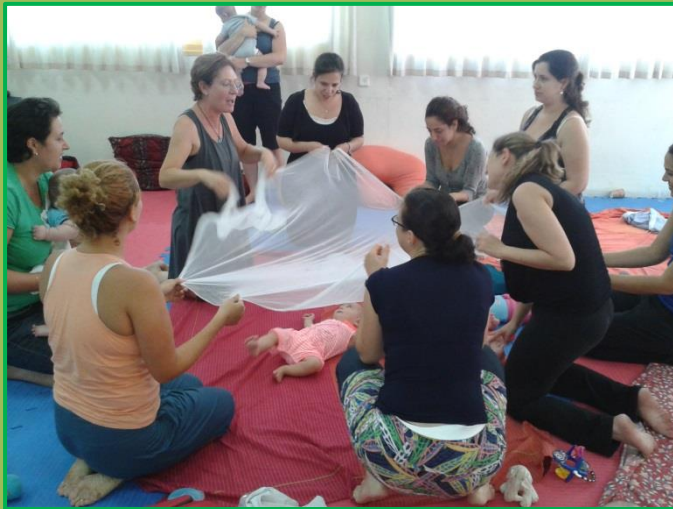
מפגש בבית הפתוח