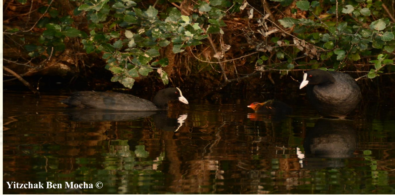
איור מס' 1 - זכר ונקבה מהמין אגמיה מצויה ( Fulica atra ).

החוג לביולוגיה וסביבה, הפקולטה למדעי הטבע, אוניברסיטת חיפה - אורנים