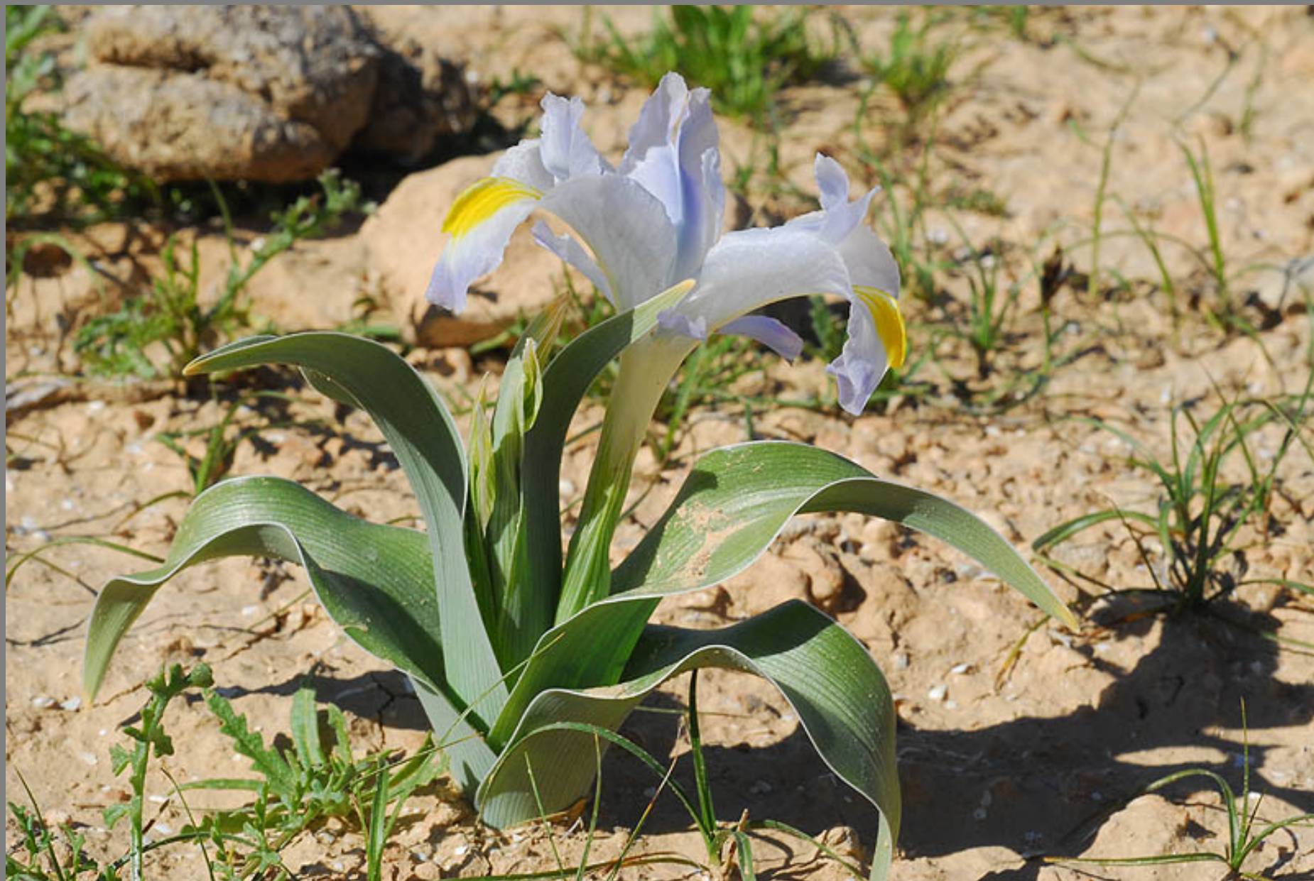
איריס טוביה (= א. עוזיהו)