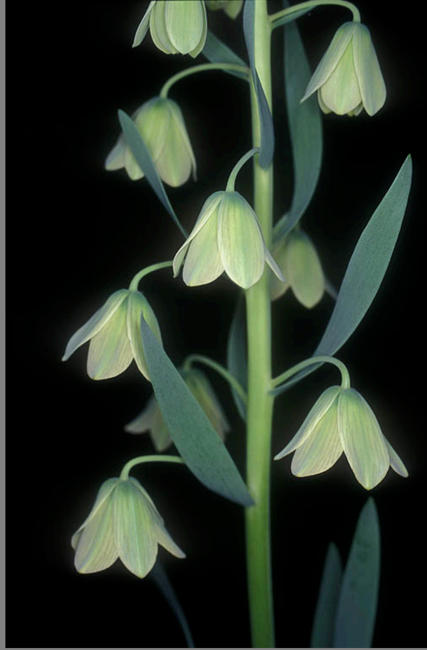
גביעונית הלבנון – זני צבע שונים