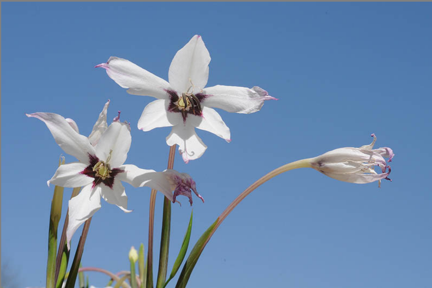
סייפן מיריאל Gladiolus murielae