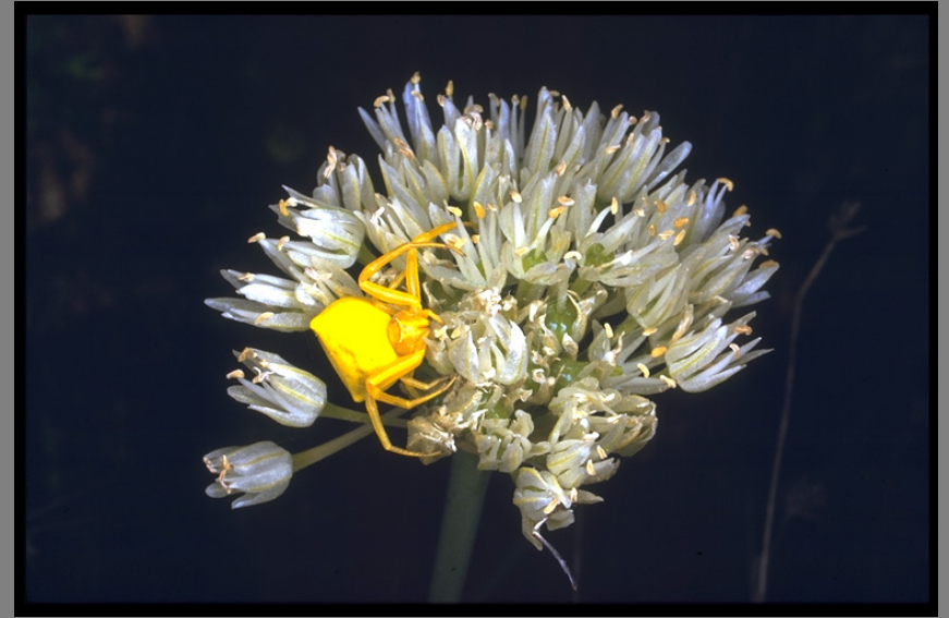
שום מזרחי Allium israeliticum