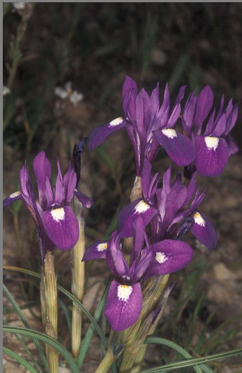
צהרון מצוי (= אחי-אירוס מצוי)