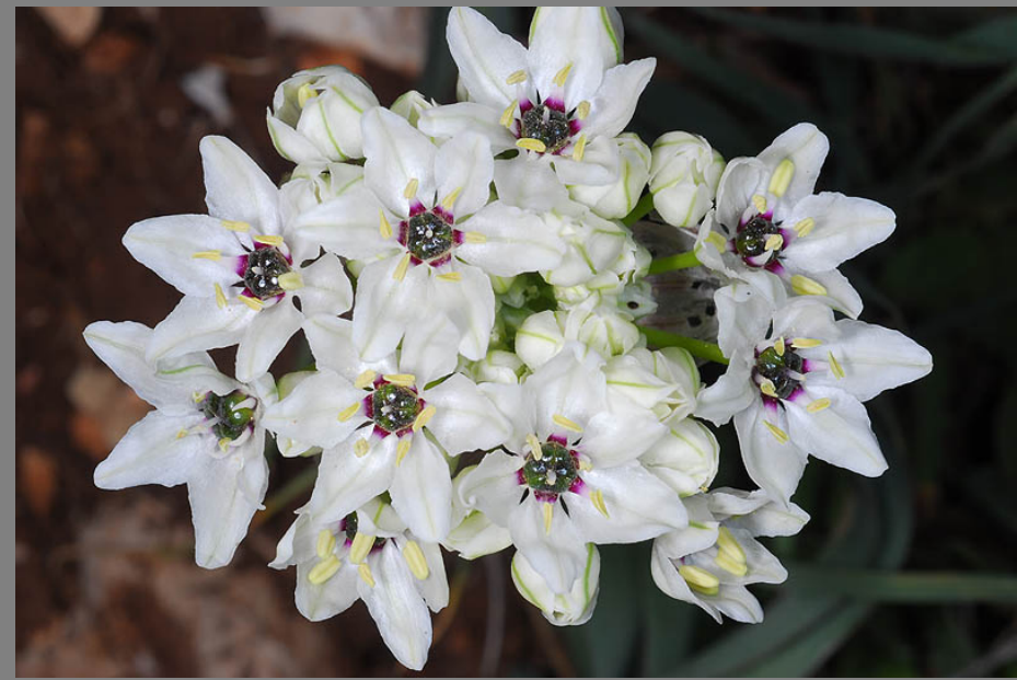
Allium meronense שום הגליל