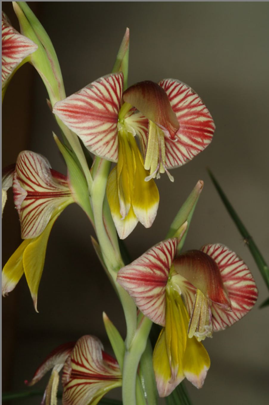
סייפן ווטרמיייר Gladiolus watermeyerii