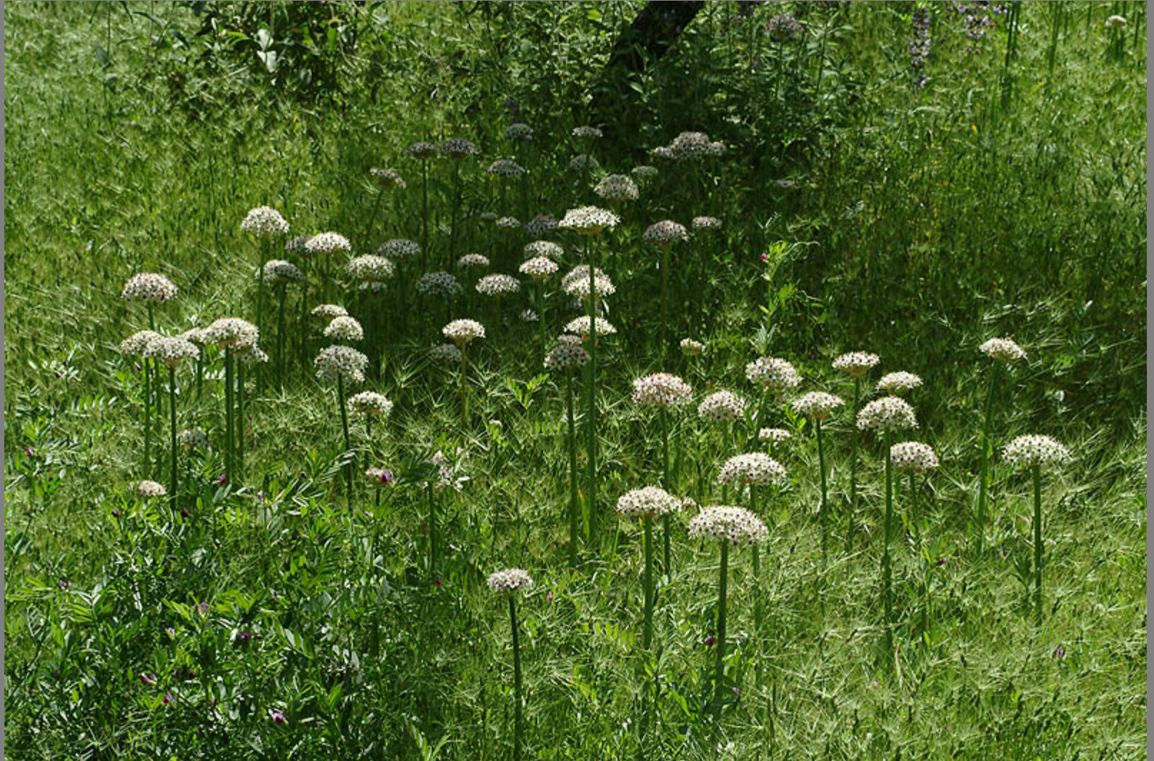
שום שחור בישראל – Allium basalticum