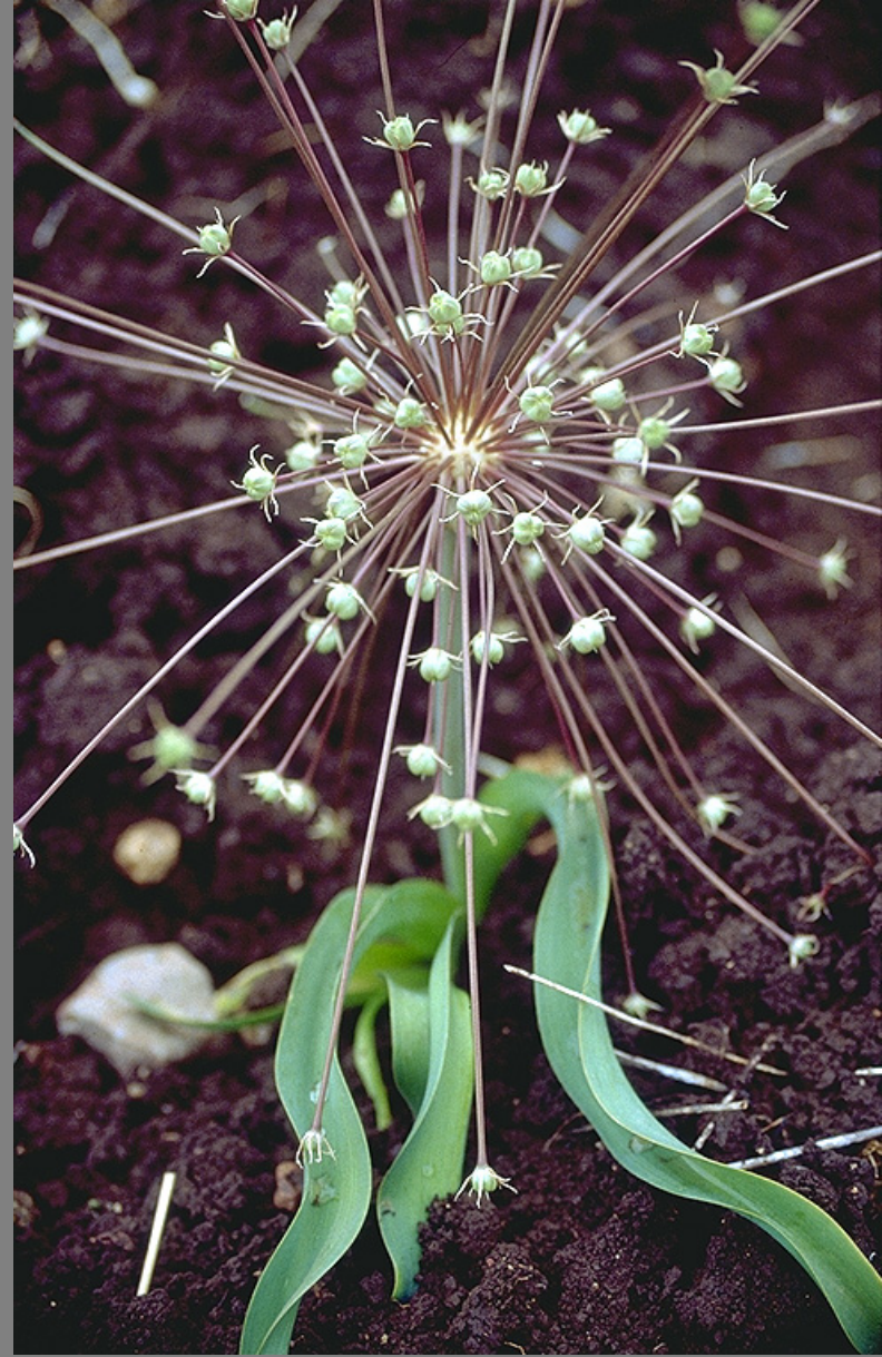
שום הגלגל, משתייך לאותה הסקציה