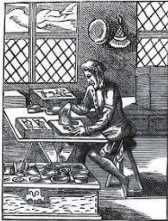
The Print Coloret. [From Jon Amassa.]

הדפס הוא טכניקה לשכפול יצירה דו ממדית, לעותקים רבים וזהים זה לזה. לפני המצאת הצילום במאה ה-14, שימש הדפס ידני לשכפול ציורים ורישומים של אמנים דגולים, ובכך התאפשרה חשיפה והפצה של האמנות בכל העולם.